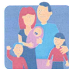
KARTA DUŻEJ RODZINY

Od 2014 roku, zgodnie z ustawą o Karcie Dużej Rodziny, gmina Sępólno Krajeńskie realizuje zadanie, a jej obsługą zajmuje się Ośrodek Pomocy Społecznej w Sępólnie Krajeńskim. Karta Dużej Rodziny to system zniżek i dodatkowych uprawnień dla rodzin 3+ zarówno w instytucjach publicznych jak i firmach prywatnych. Posiadacze KDR mają możliwość tańszego skorzystania z oferty podmiotów m.in. z branży spożywczej, paliwowej, bankowej czy rekreacyjnej. KDR wspiera budżety rodzin wielodzietnych oraz ułatwia dostęp do dóbr i usług. Od stycznia 2018 roku Karta Dużej Rodziny dostępna jest w dwóch formach: tradycyjnej (plastikowej) i elektronicznej (na urządzeniach mobilnych).