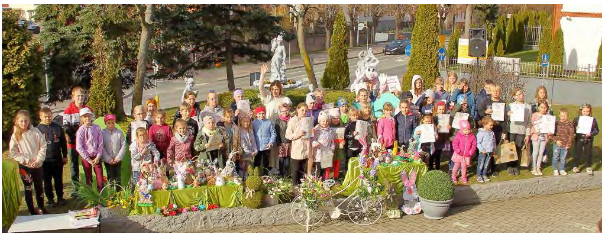
Laureaci konkursu plastycznego na wielkanocnego zajęczka