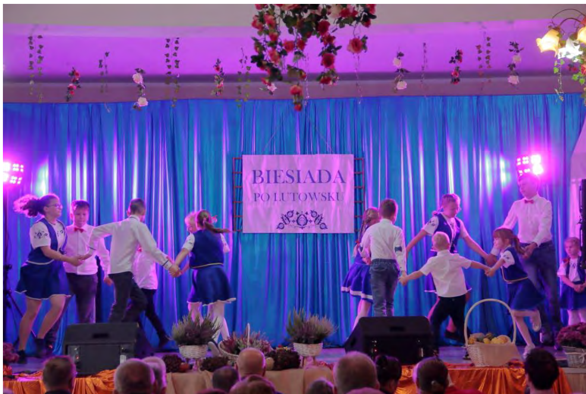
Biesiada po Lutowsku w Wiejskim Ośrodku Kultury w Lutowie