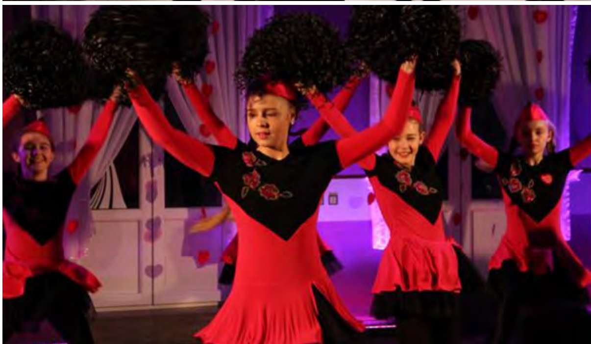
Zajęcia z cheerleadingu „Cheerleaders Academy”