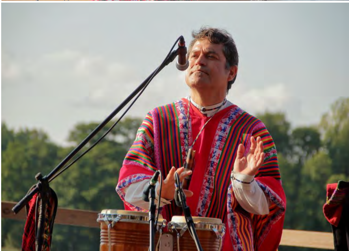
Koncert zespołu Los Companieros – sępoleńskie molo