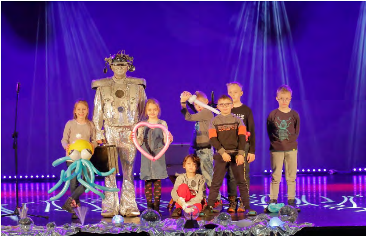
Ferie zimowe w Centrum Kultury i Sztuki w Sępólnie Krajeńskim

Głównym celem naszego projektu było rozbudzanie dziecięcej wyobraźni, inwencji twórczej oraz kreatywności. Podczas tegorocznych, zimowych warsztatów mali uczestnicy doświadczali różnego rodzaju eksperymentów, brali udział w inspirujących burzach mózgów a w rezultacie zabaw badawczych i obserwacji, stali się twórcami finałowego pokazu. Rozwijanie spostrzegawczości, kojarzenia, umiejętności tworzenia historii oraz narracji, doskonalenie słuchania ze zrozumieniem a także trafne odczytywanie symboli oraz znaków to zaledwie namiastka kompetencji, jakich rozwój zapewniły nasze zimowe ferie.