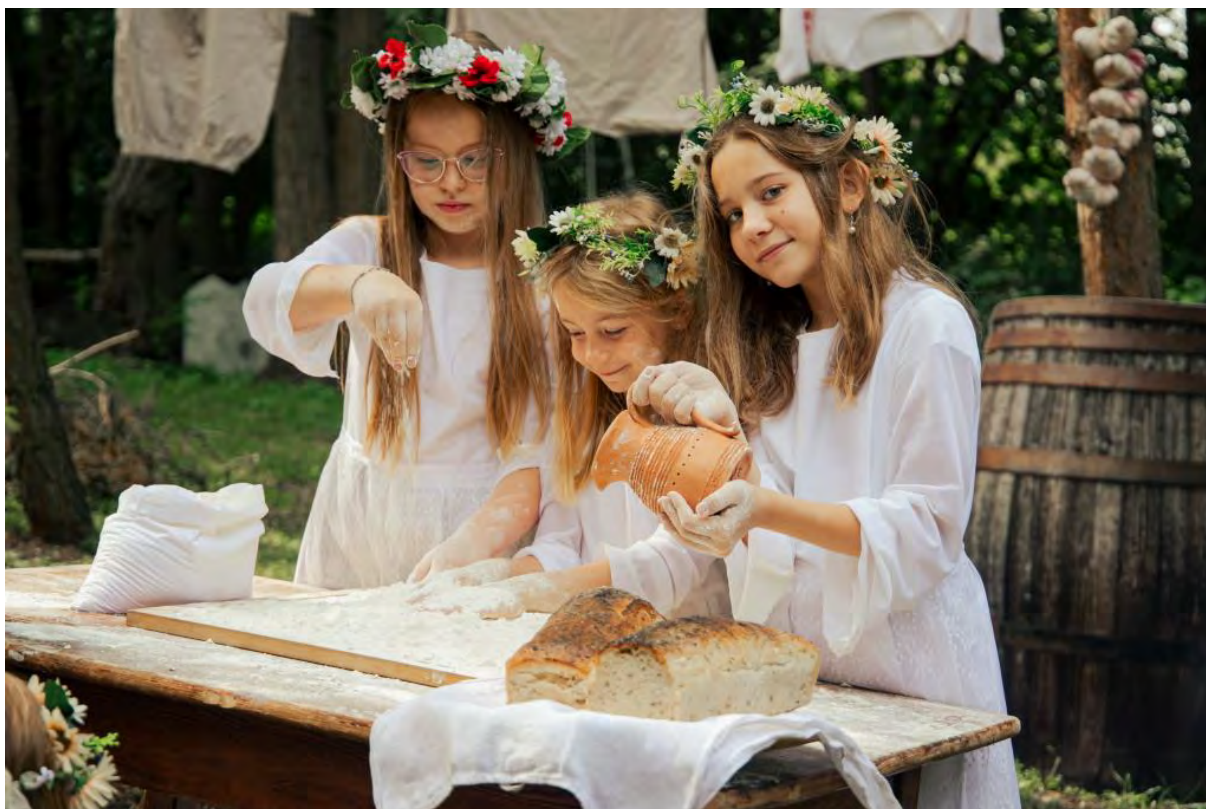
Etno wakacje w Centrum Kultury i Sztuki w Sępólnie Krajeńskim