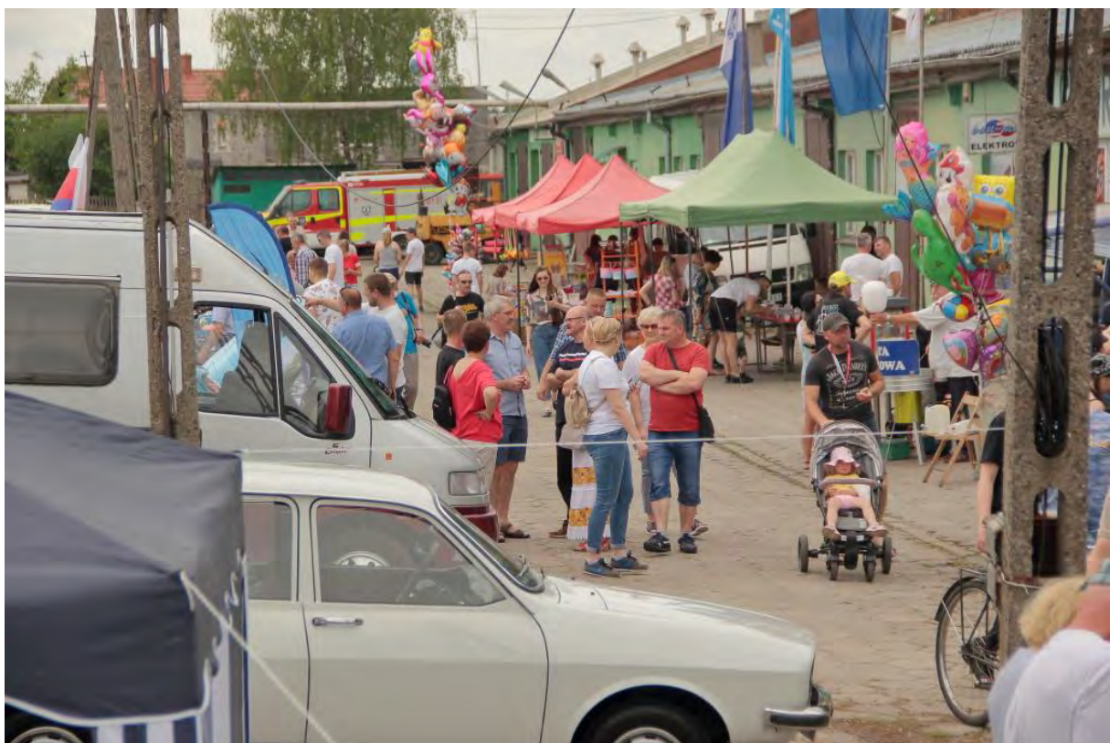
Złot Pojazdów w Sępólnie Krajeńskim