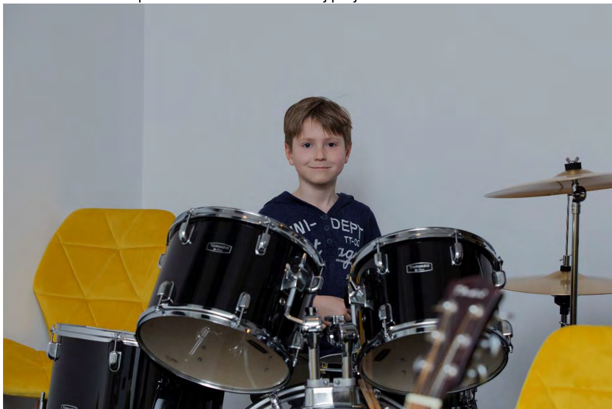
Nauka gry na perkusji

Perkusja to wspaniały instrument, który wzbudza zachwyt u wielu melomanów. Nauka gry na perkusji może wydawać się trudna, jednak wystarczy trochę samozaparcia i pracy. Zajęcia przeznaczone są dla dzieci i młodzieży od 7 roku życia - wtedy najszybciej może być przyswajana nauka gry na perkusji. Wiek ten jest najbardziej odpowiedni w ogóle na naukę gry na instrumencie lub pobudzenie w maluchu innej pasji.