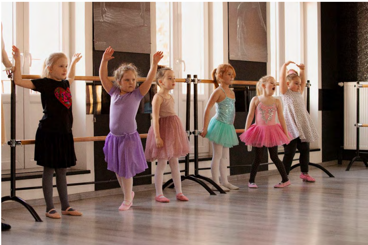
Zajęcia baletowe „Akademia Balerina”