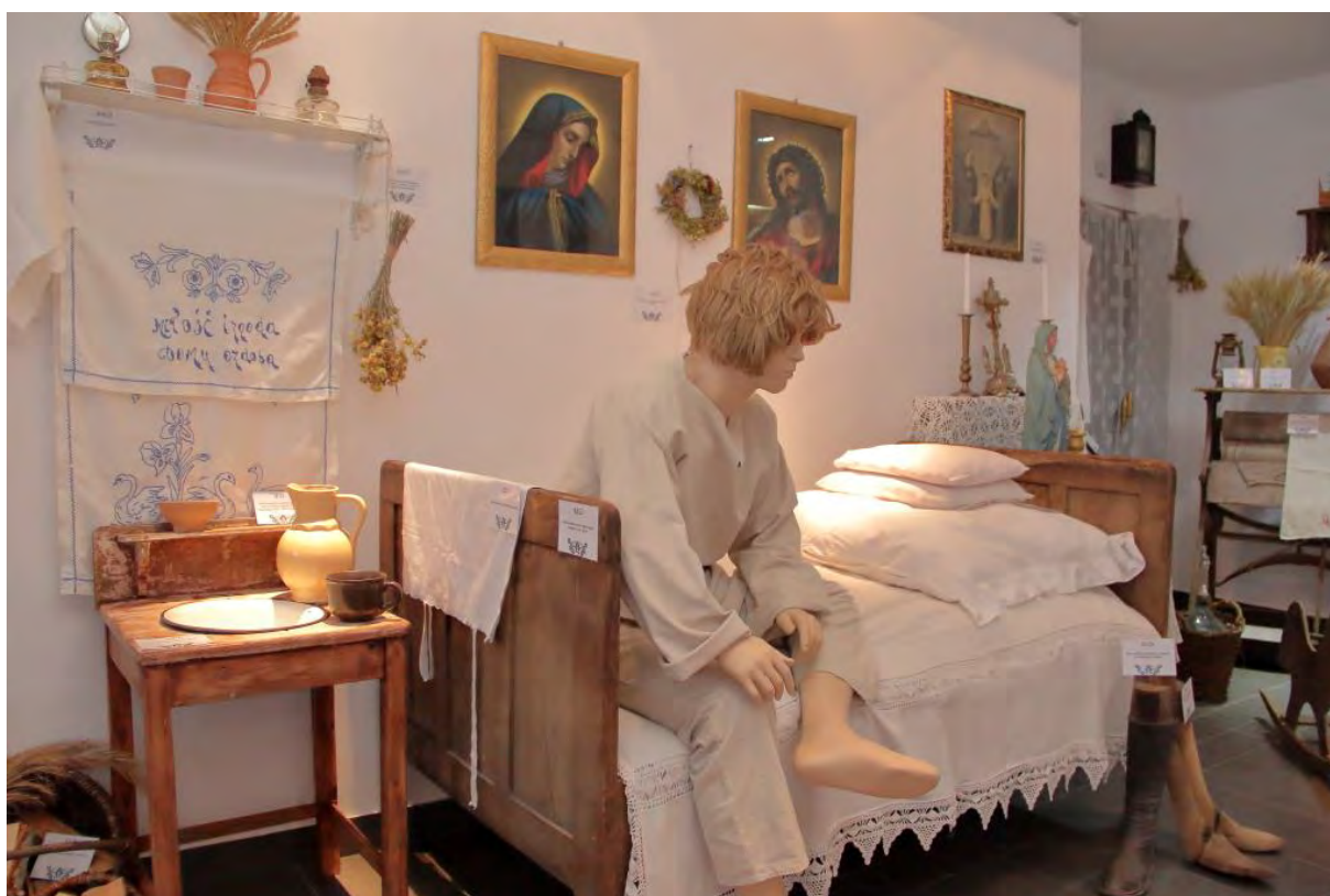
Izba Dziedzictwa Kulturowego w Sępólnie Krajeńskim