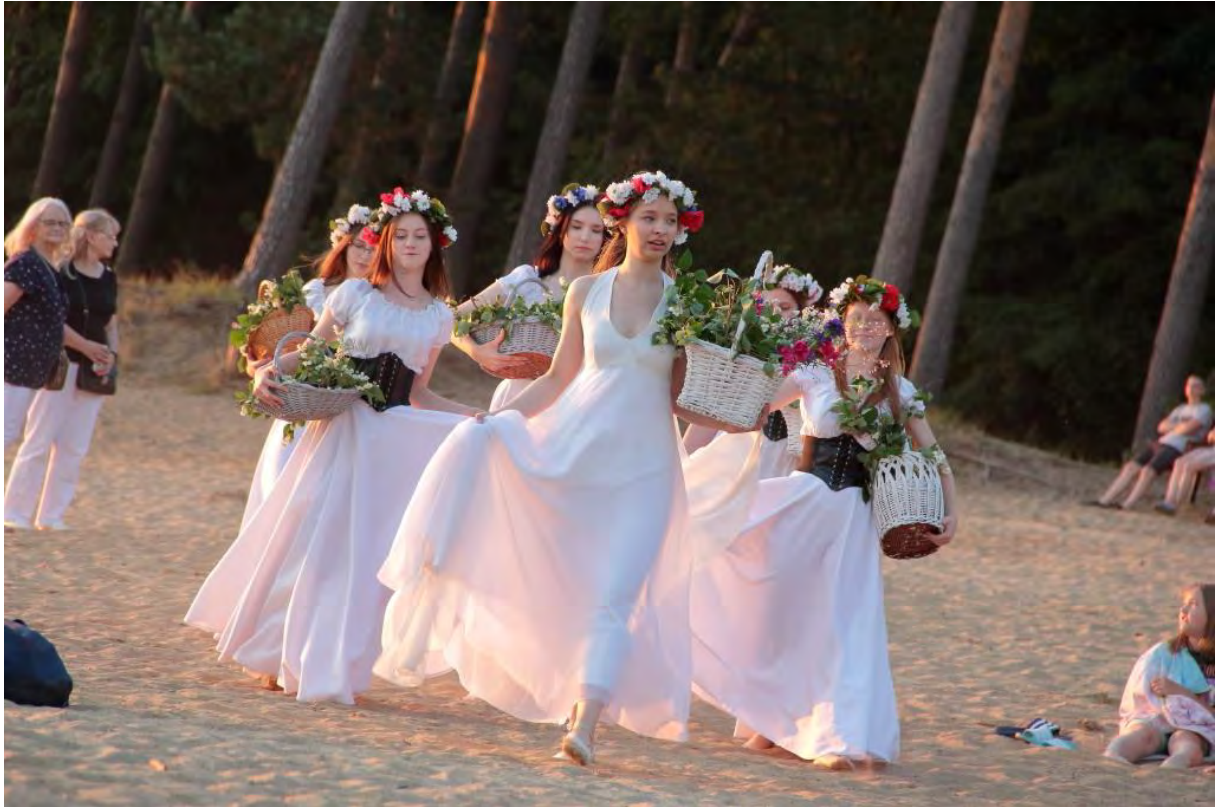
Studio Tańca STYL Centrum Kultury i Sztuki w Sępólnie Krajeńskim