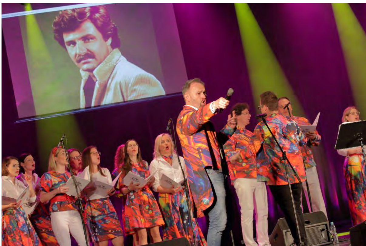
Chór Euforia w Centrum Kultury i Sztuki w Sępólnie Krajeńskim