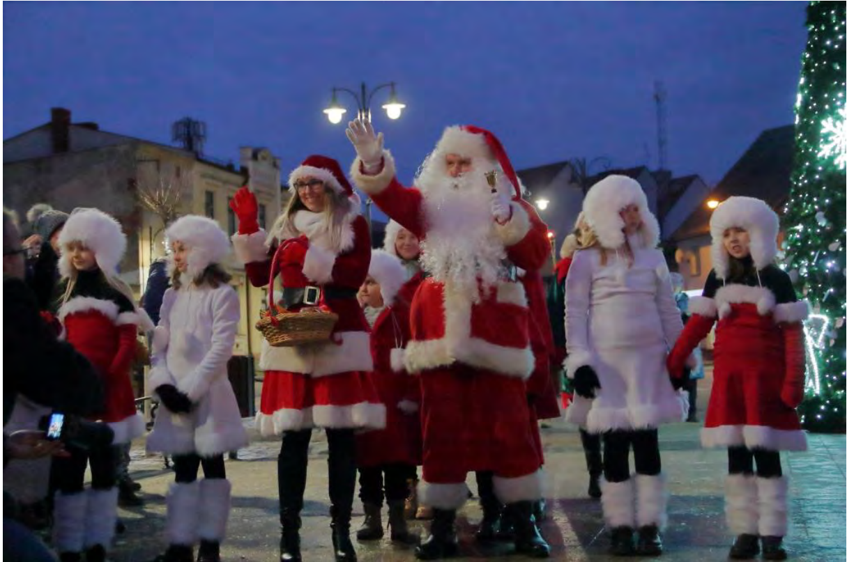
Święty Mikołaj na Placu Wolności w Sępólnie Krajeńskim