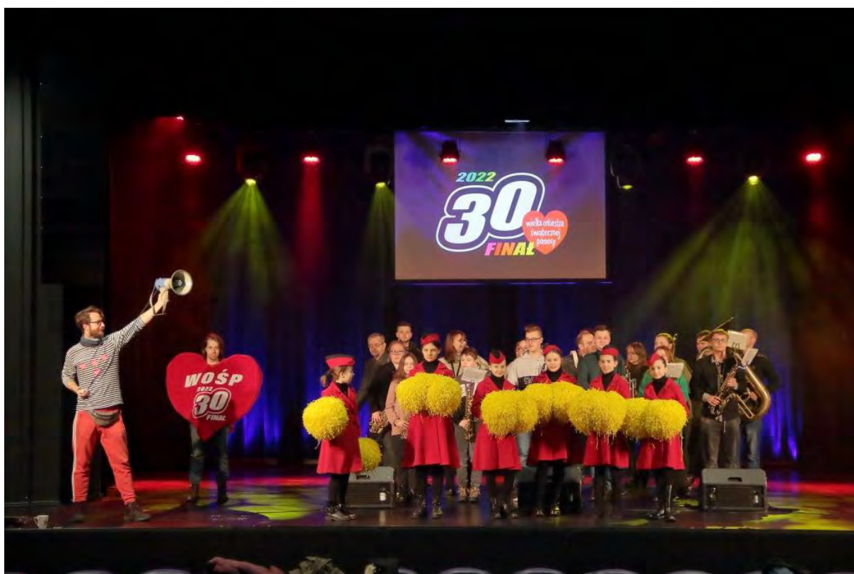
30. Finał WOŚP w CKiS – Sępoleńska Orkiestra Dęta z CHEERLEADERS ACADEMY

Finał WOŚP to zazwyczaj feeria kolorów, dźwięków i pozytywnej energii. To także ogromna wdzięczność i moc podziękowań pod adresem wszystkich tych, bez których idea pomocy nie mogłaby się ziścić. Byliście Państwo z nami na wiele sposobów. Byli wśród Was wolontariusze, darczyńcy, osoby zasilające licytacje oraz uliczne zbiórki. Byliście Państwo wszędzie tam gdzie dopełniało się bezinteresowne dobro. Dziękujemy i nie przestaniemy dziękować do końca świata i jeden dzień dłużej.