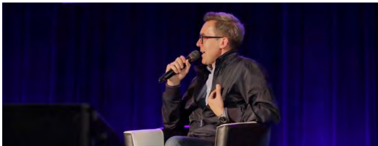
Maciej Kurzajewski – Sępoleńska Akademia Sukcesu w CKiS w Sępólnie Krajeńskim

Zgodnie z formułą Sępoleńskiej Akademii Sukcesu nasz gość zwrócił się do publiczności, którą w znakomitej większości stanowiła młodzież z sępoleńskich szkół średnich, z autorską „receptą na sukces”. Kurzajewski podkreślał, jak ważnym jest by mieć w życiu pasję i tę pasję pielęgnować, nawet jeśli nie zawsze będzie ona przynosiła wymierne korzyści materialne. Tylko w ten sposób będziemy w stanie osiągnąć pełnię satysfakcji zawodowej i osobistej, bo w końcu możliwość spełniania marzeń, realizacji swoich pasji poprzez pracę, jest dla wielu z nas miarą prawdziwego sukcesu.