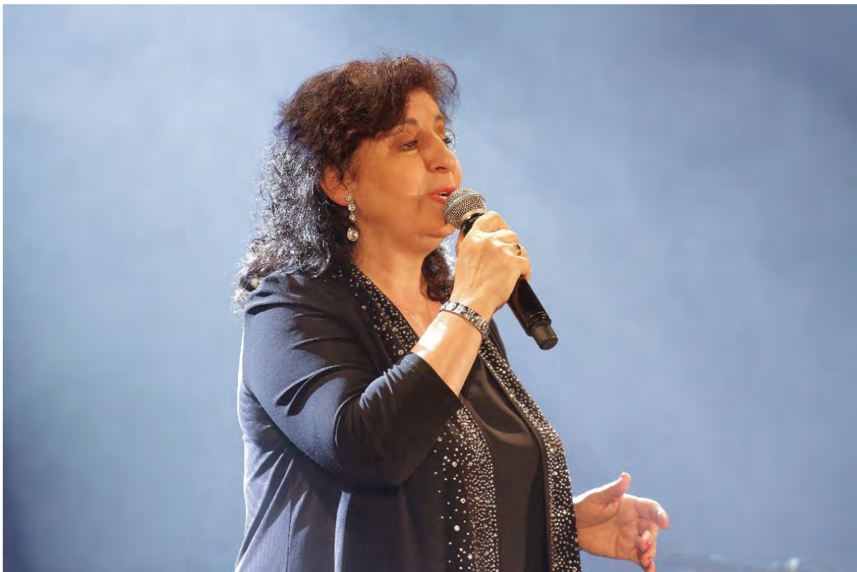
Koncert Eleni w Centrum Kultury i Sztuki w Sępólnie Krajeńskim