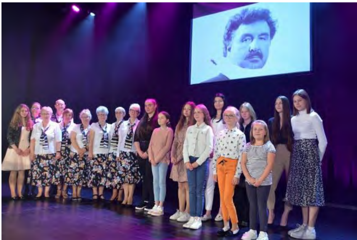
Młodzieżowe i Dziecięce Studio Piosenki CKiS w Sępólnie Krajeńskim oraz sekcje wokalne MGOK w Więcborku i MGOK w Kamieniu Krajeńskim

„Nie wszyscy wielcy już przestali grać” to kolejny koncert zorganizowany w hołdzie Krzysztofowi Krawczykowi. Najpiękniejsze piosenki artysty usłyszeliśmy w wykonaniu Młodzieżowego i Dziecięcego Studia Piosenki CKiS w Sępólnie Krajeńskim oraz sekcji wokalnych MGOK w Więcborku i MGOK w Kamieniu Krajeńskim. Ponadczasowe przeboje w wielopokoleniowym opracowaniu solistów oraz grup wokalnych z lokalnych ośrodków kultury to coś, czego miłośnicy twórczości Krzysztofa Krawczyka nie mogli przegapić!