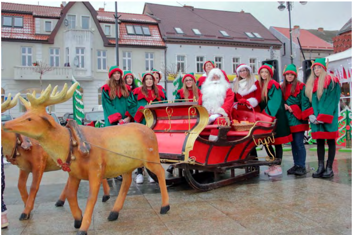
Święty Mikołaj z Elfami w Sępólnie Krajeńskim