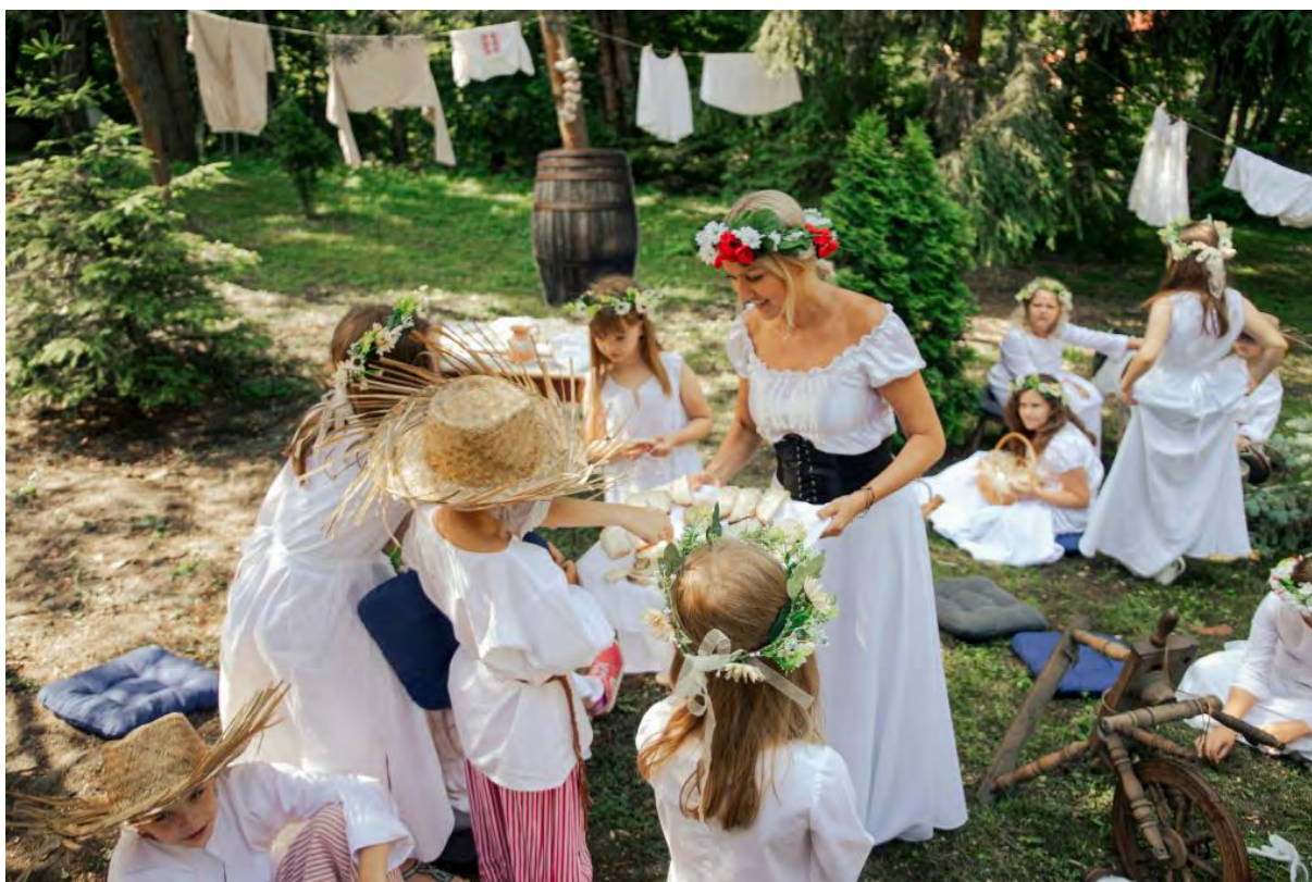
Etno wakacje w Centrum Kultury i Sztuki w Sępólnie Krajeńskim