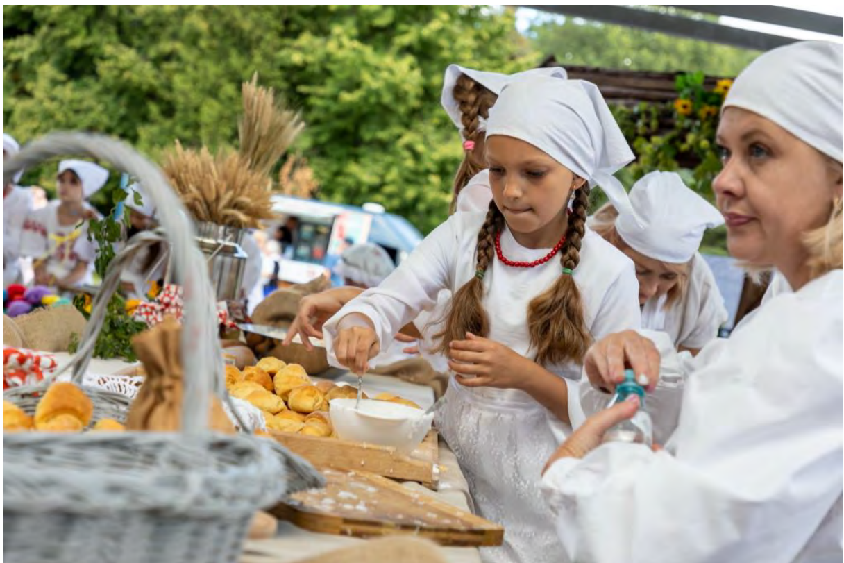
Jarmark św. Wawrzyńca w Sępólnie Krajeńskim