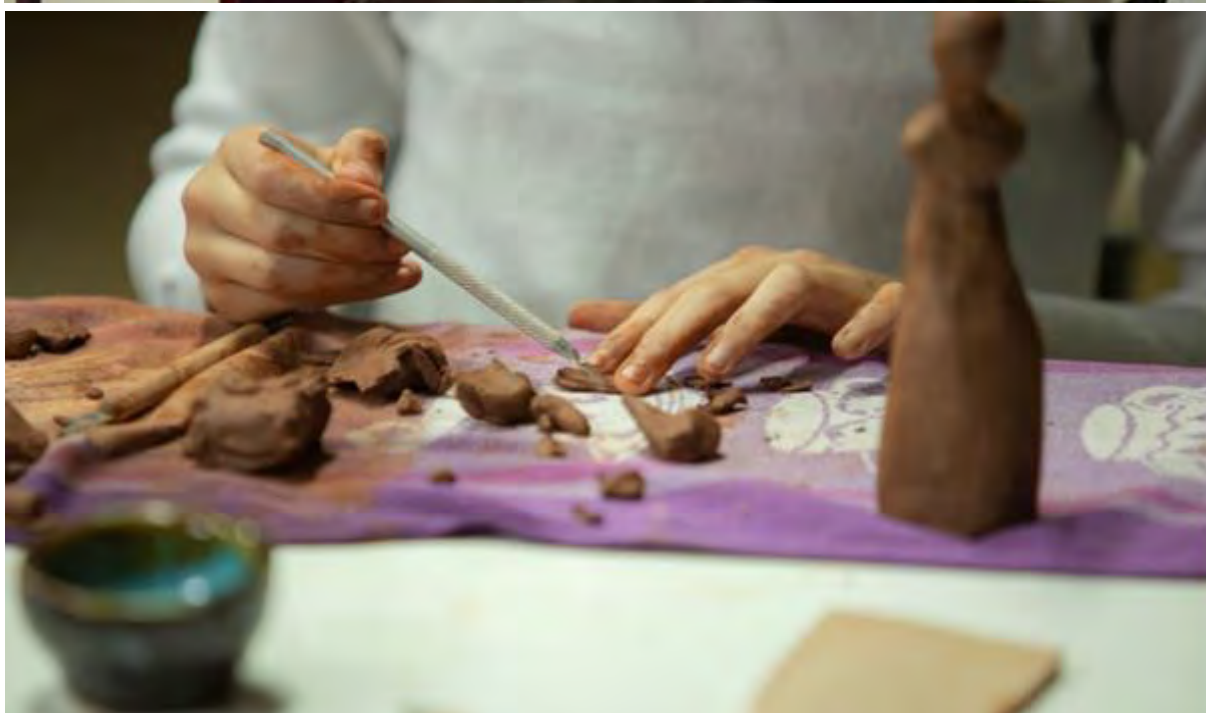
Zajęcia ceramiczne „Rzeźba z gliny”