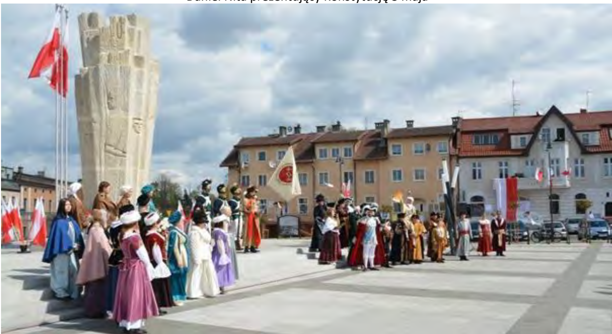
Obchody Konstytucji 3 maja na Placu Wolności w Sępólnie Krajeńskim