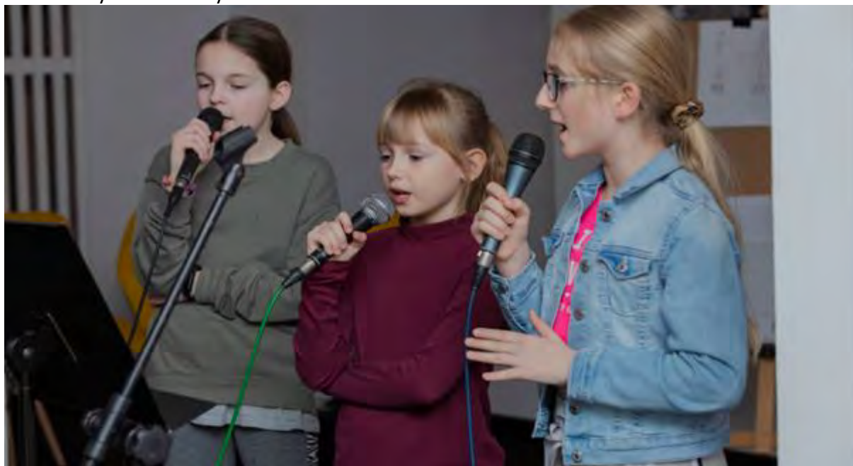
Dziecięce i Młodzieżowe Studio Piosenki

Dziecięce i Młodzieżowe Studio Piosenki to idealne miejsce dla przyszłych artystów, którzy marzą o tym by porywać tłumy śpiewem. Zajęcia w ramach studia piosenki uczą nie tylko kontroli głosu, korzystania z przepony i wrażliwości na dźwięki, ale pozwalają oswoić się z mikrofonem, a praca nad różnorodnym repertuarem pomaga stopniowo nabierać pewności siebie, niezbędnej do świadomego i poprawnego wykonania utworu podczas występu. Nasi artyści będą mieli bowiem niejedną okazję by sprawdzić postępy nauki w warunkach koncertowych. Praktyka czyni mistrza, a scena weryfikuje nasze umiejętności – dzięki występom nabieramy doświadczenia, a także zyskujemy cenne wskazówki, które pozwalają nam ukierunkować przyszłą naukę. Wyśpiewaj sobie drogę do sukcesu – od absolutnych początków, aż po zaawansowane solowe improwizacje. Zajęcia dedykowane dzieciom i młodzieży od 6 roku życia.