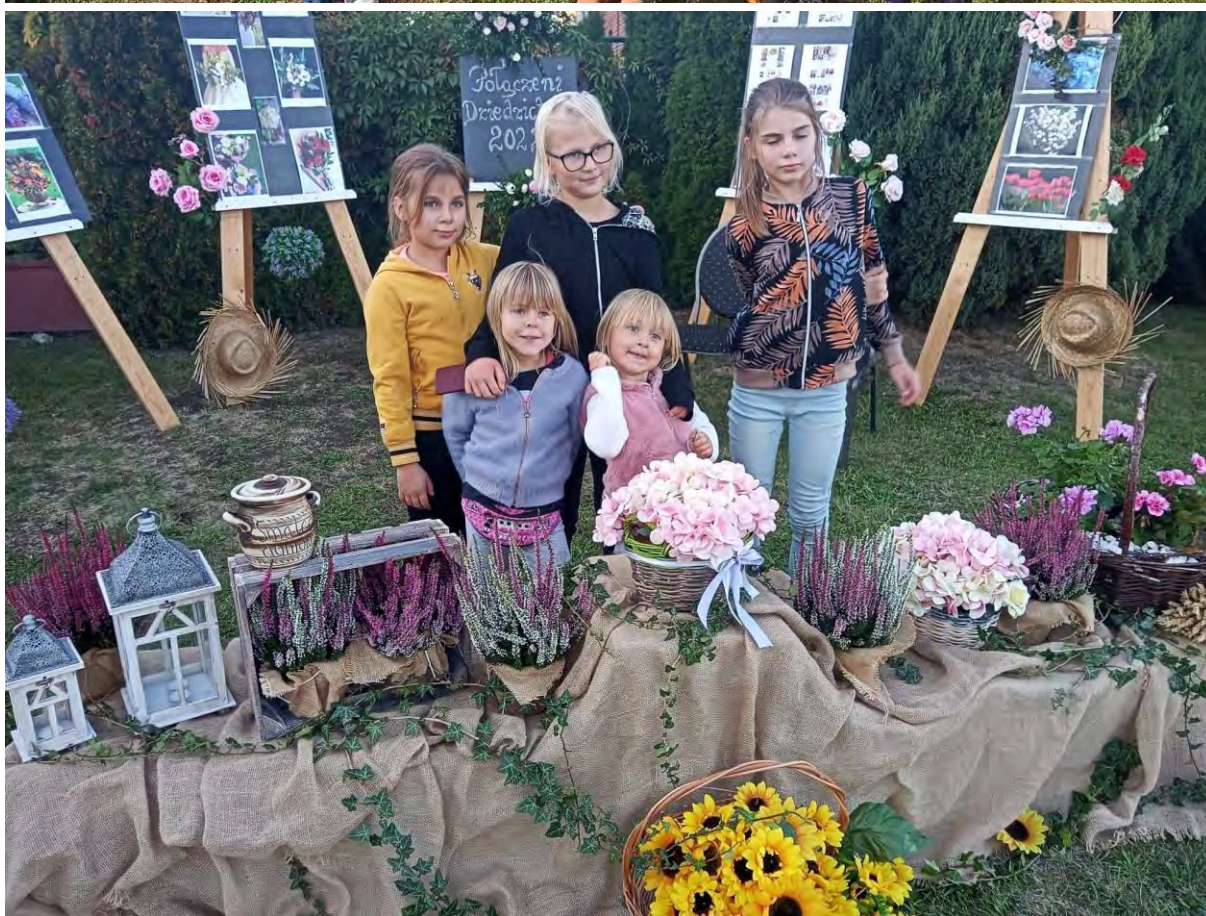
Europejskie Dni Dziedzictwa w Wysokiej Krajeńskiej