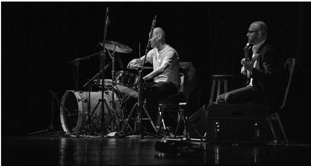
Zespół Czerwie - CKiS w Sępólnie Krajeńskim

Zespół Czerwie to grupa profesjonalistów, która swój profesjonalizm legitymizuje ponad dwudziestoletnim stażem scenicznym oraz bogatym doświadczeniem w zakresie tworzenia ścieżek dźwiękowych pod ruchomy obraz. Dźwiękowe komentarze Czerwi są niezwykle absorbujące, a przy tym perfekcyjnie skorelowane z akcją filmu. Paleta emocji, którą oferują muzycy sprawia, że nieme obrazki w sugestywny sposób do nas „przemawiają”. Jeśli nieme kino traktowano jako teatr bez słów, to właśnie muzyka towarzysząca tym filmom dawała „głos” aktorom. Poza tym wszystkim Czerwi najwyczejniej dobrze się słucha – zamykając na moment oczy, stymulowana dźwiękami (od psychodelii przez avant-folk aż po ambient) wyobraźnia podpowiada nam rozmaite, filmowe historie.