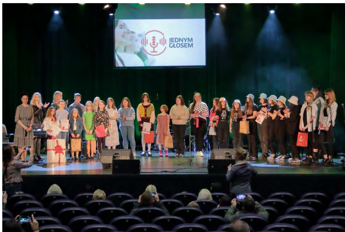
Laureaci Finału I Wojewódzkiego Konkursu Zespołów Wokalnych „Jednym głosem”

Szczególne podziękowania kierujemy w stronę instruktorów i nauczycieli, którzy przygotowali swoich podopiecznych do dzisiejszych występów mimo trudności jakie niosły ostatnie dwa lata. Jesteśmy pełni uznania dla instruktorów i młodych artystów, którzy zdecydowali się wystąpić bez wykorzystania mechanicznych podkładów muzycznych. Żywimy przekonanie, że wykonywanie utworów muzycznych z tzw. żywym akompaniamentem, a cappella czy nawet z wykorzystaniem własnego ciała jako instrumentu perkusyjnego (klaskanie, tupanie, pstrykanie) daje pole to szerszego rozwoju muzycznego i nieskrępowanej interpretacji, na co nie zawsze można sobie pozwolić wybierając podkład muzyczny.