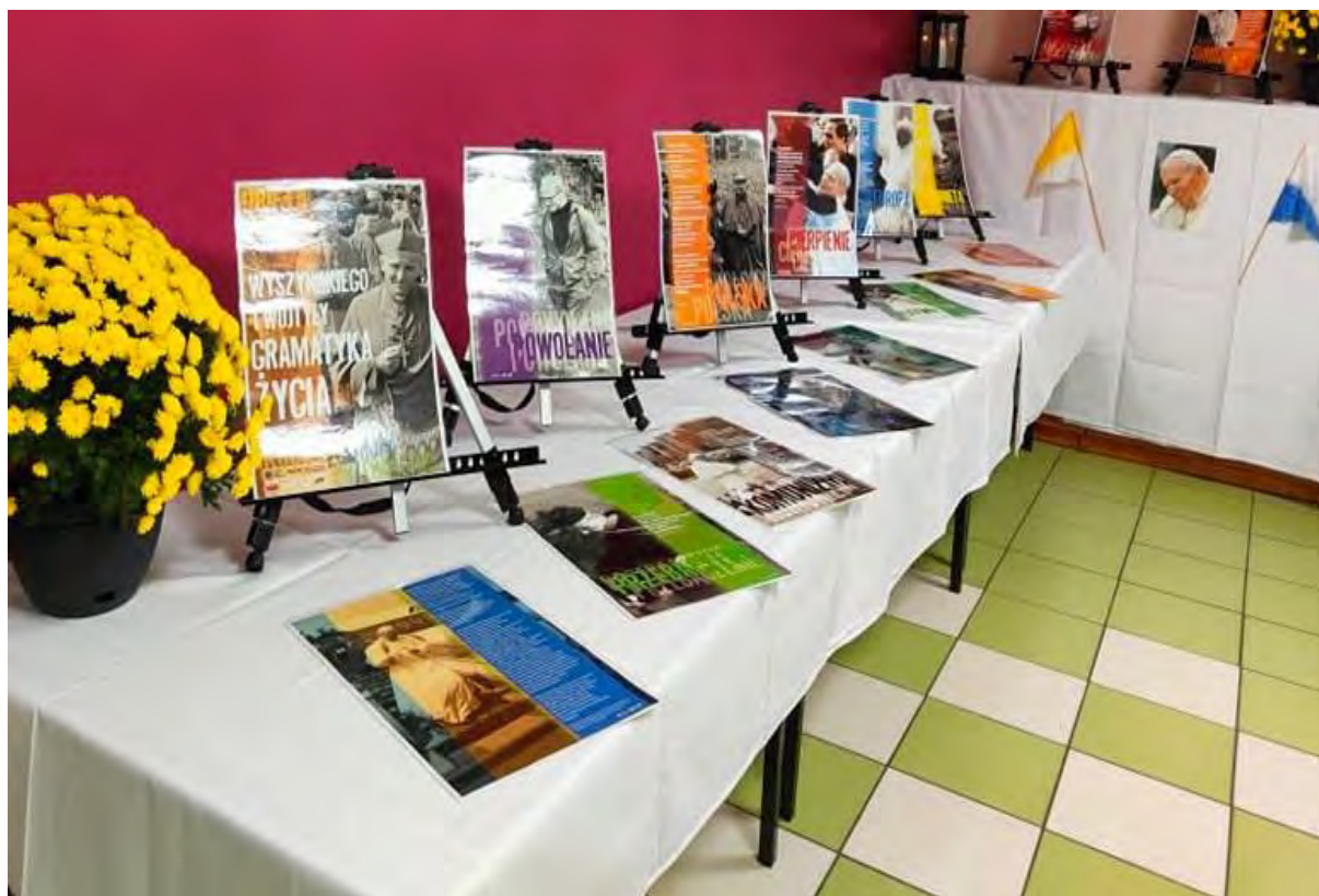
Wystawa „Wyszyńskiego i Wojtyły gramatyka życia” w świetlicy wiejskiej w Kawlach

W ramach obchodów XXIII Powiatowego Tygodnia Kultury Chrześcijańskiej udostępniliśmy do zwiedzania przygotowaną przez Biuro Edukacji Narodowej, IPN oraz Muzeum Jana Pawła II i Prymasa Wyszyńskiego wystawę „Wyszyńskiego i Wojtyły gramatyka życia”.