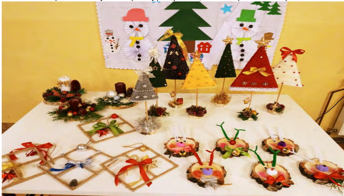
„Czujesz? Pachnie świętami!” świetlica wiejska w Wałdówku

Czując atmosferę Bożego Narodzenia w Wałdówku odpowiednio wcześniej rozpoczęliśmy robótki ręczne. Nasze artystyczne starania były zarówno formą zabawy, relaksu, jak i wyzwania. Ozdoby robione w świetlicy to najpiękniejsza dekoracja każdego wnętrza. To również wspaniała okazja do wspólnej pracy dzieci, młodzieży oraz dorosłych.