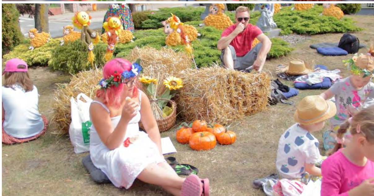
Śniadanie na trawie przy Centrum Kultury i Sztuki w Sępólnie Krajeńskim