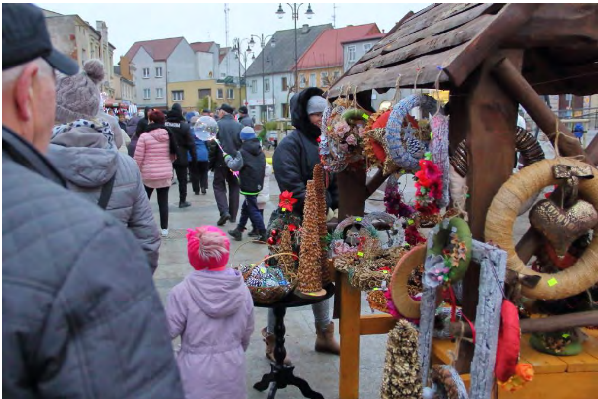
Dzień Adwentowy w Sępólnie Krajeńskim