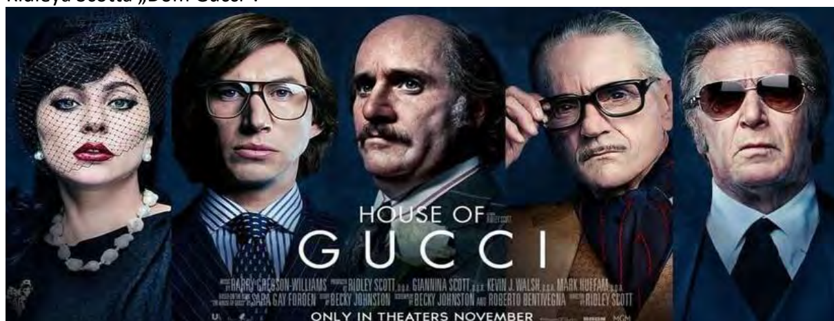
Ridley Scott „Dom Gucci”

Nowy Rok zainicjowaliśmy kolejną wizytą Zakrzywienia Czasoprzestrzeni. 16 i 17 stycznia wyświetlaliśmy najgorętsze filmowe hity – dwie przygodowe animacje „W 80 dni dookoła świata”, „O czym dzisiaj marzą zwierzęta”, czwartą część jednej z najpopularniejszych polskich komedii „Koniec świata czyli Kogiel Mogiel 4” oraz opowieść o modowej dynastii w reżyserii Ridleya Scotta „Dom Gucci”.