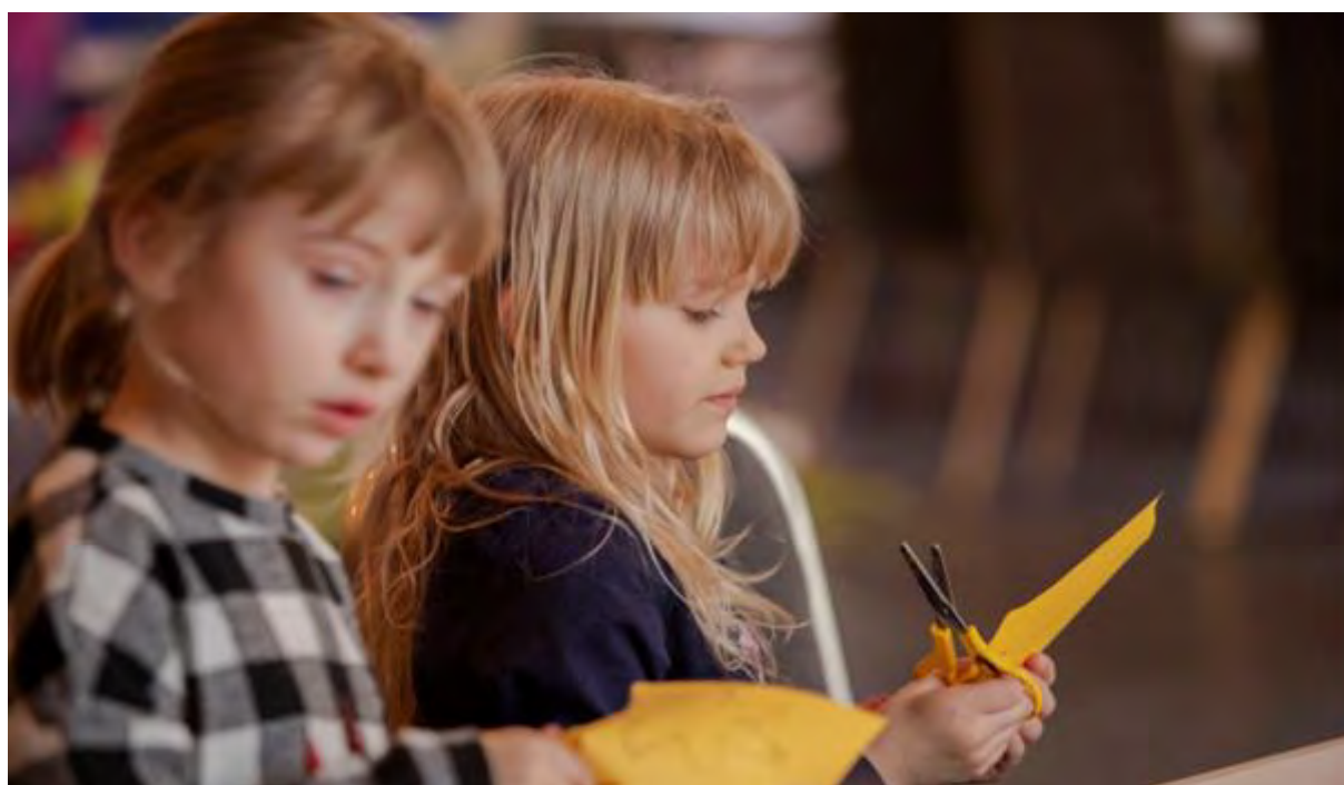
Zajęcia plastyczne „Akademia Plamokleksa”