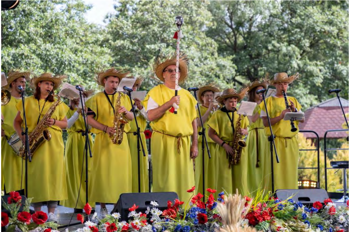
Sępoleńska Orkiestra Dęta