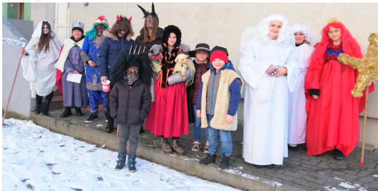
Kolędnicy z świetlicy wiejskiej w Iłowie