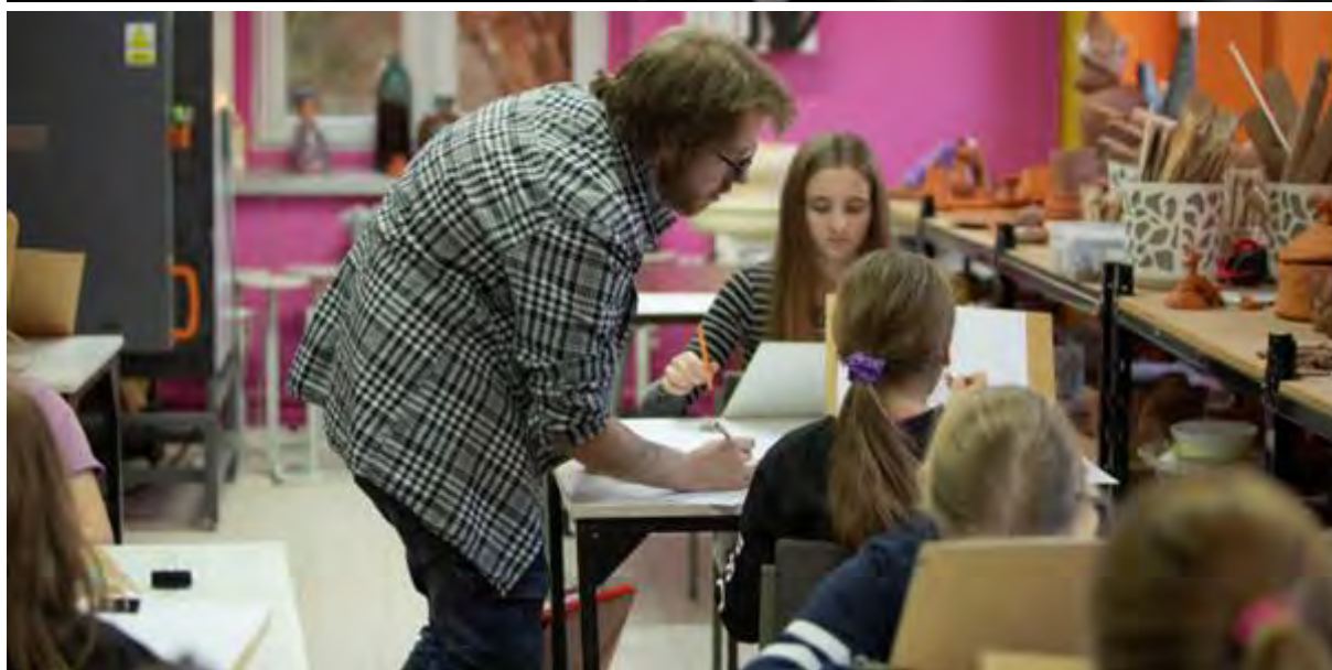
Zajęcia rysownicze „Akademia Portretu”