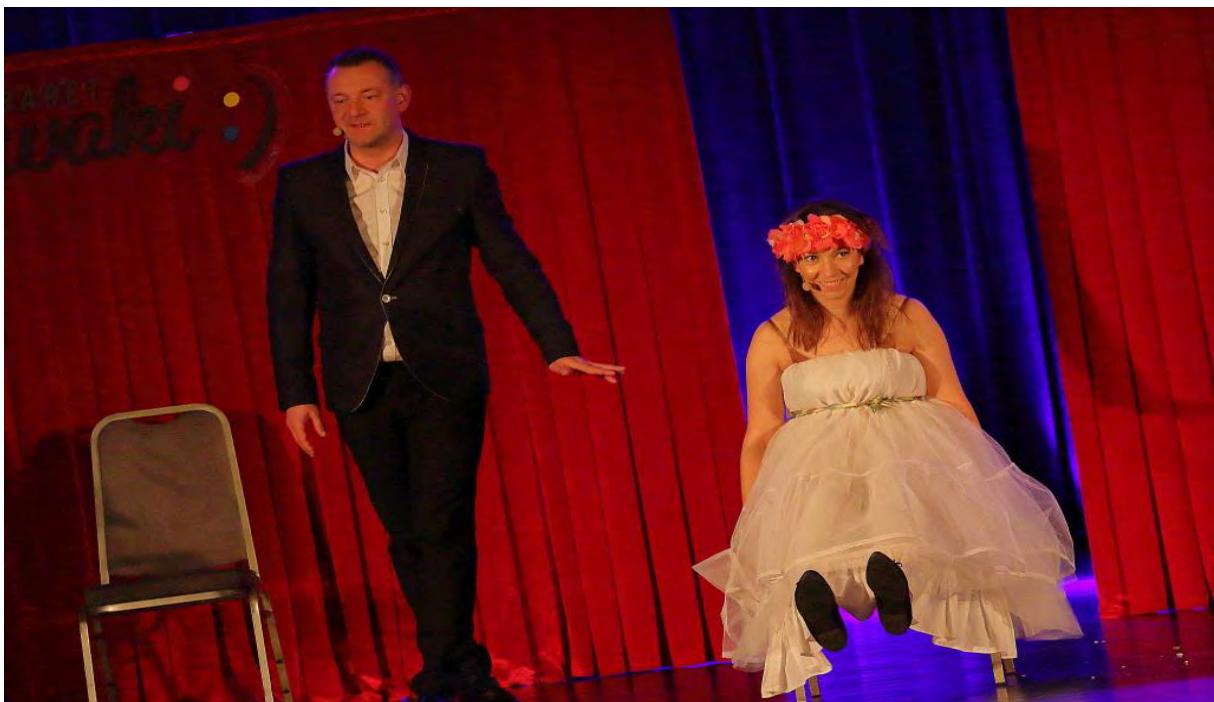
Kabaret Nowaki w Centrum Kultury i Sztuki w Sępólnie Krajeńskim