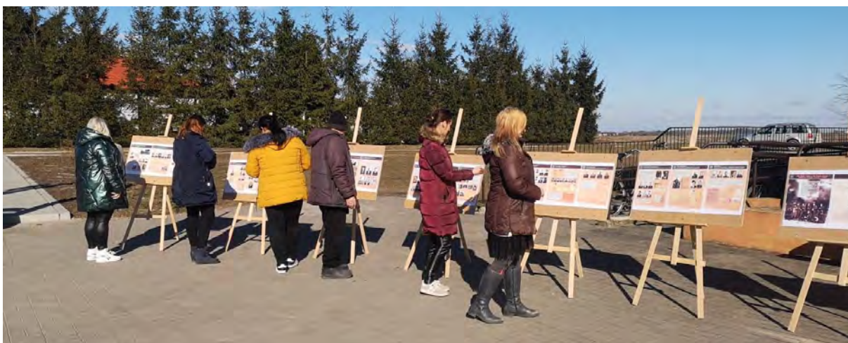
Wystawa „Dla Ciebie, Polsko i dla Twojej chwały” w Wiejskim Ośrodku Kultury w Wałdowie