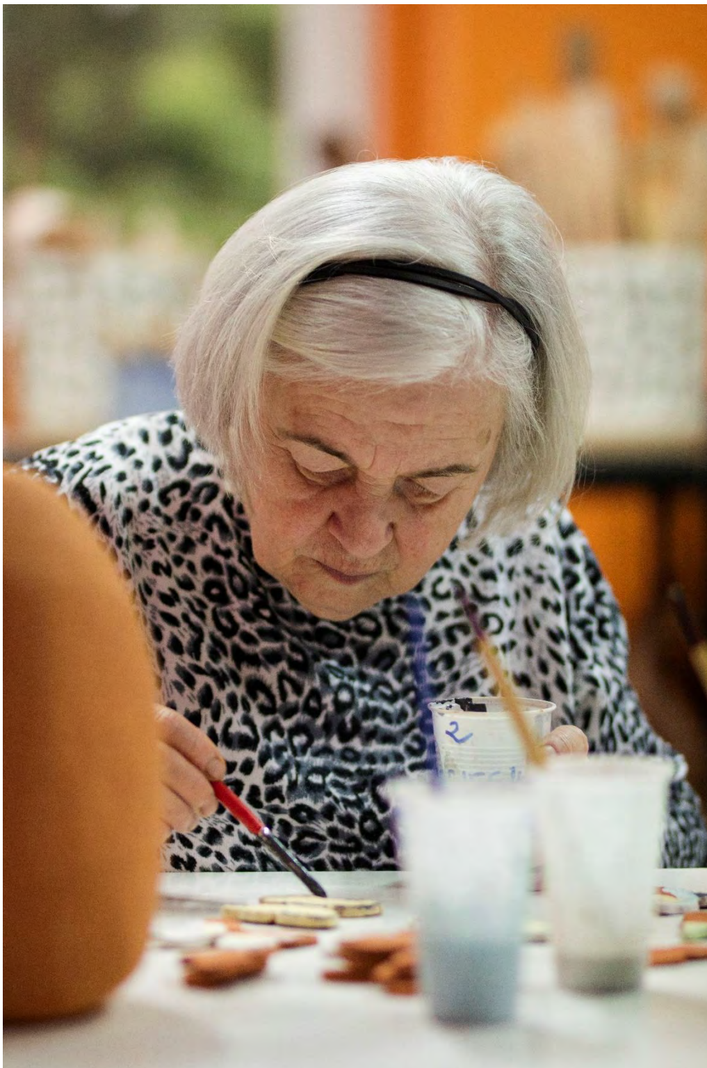
Zajęcia ceramiczne dla dorosłych „Sztuka ceramiczna”

Praca z gliną potrafi wyciszyć. Ugniatany, wirujący, formowany na różne sposoby pod naszymi rękoma materiał powoli przeistacza się w dzieło sztuki. Jest w tym coś metafizycznego. Można by rzec, że pobudzamy wówczas mitologiczny pierwiastek „Stwórcy”, który tkwi w każdym z nas. Podczas relaksujących zajęć adresowanych dla dorosłych wyzwalamy z siebie tę twórczą energię, a później podziwiamy jej efekty. Wierzymy, że Artysta tkwi w każdym z nas, a sztuka ma zdolności terapeutyczne.