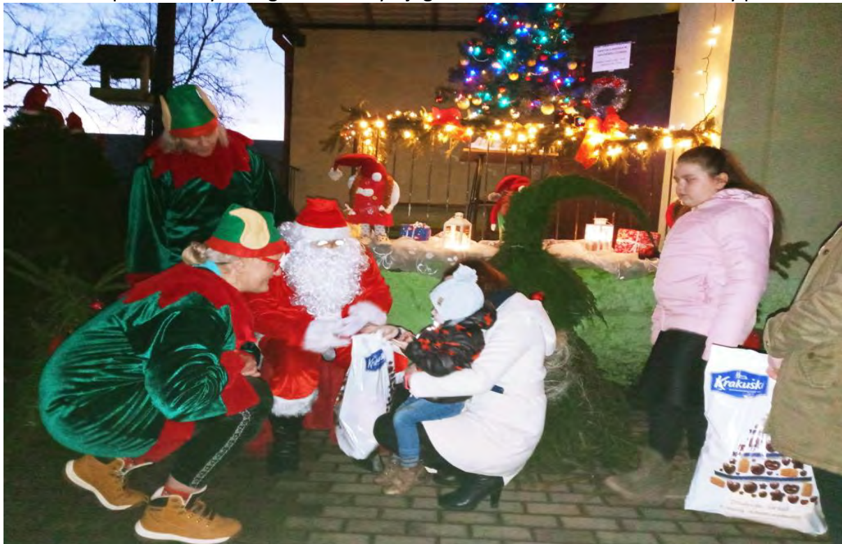
Spotkanie z Mikołajem w świetlicy wiejskiej w Wałdówku

17 grudnia w Wałdówku odbyło się spotkanie ze Świętym Mikołajem. Wszystkie dzieci bez ociągania pojawiły się przed świetlicą. Wyczekiwały Świętego w napięciu nasłuchując radosnego okrzyku „Ho, Ho, Ho!”, aż w końcu Mikołaj pojawił się w towarzystwie elfów. Dzieci przywitały gości i zaprosiły ich do koła zabaw. Gdy Mikołaj zasiadł wygodnie na specjalnie przygotowanym fotelu, rozpoczęliśmy pamiątkową sesję zdjęciową. Każdy maluch w ramach podziękowania za przybycie Mikołaja wyrecytował dla niego wierszyk lub zaśpiewał kolędę. Atmosfera spotkania była magiczna. Każdy z jego uczestników został obdarowany prezentem.