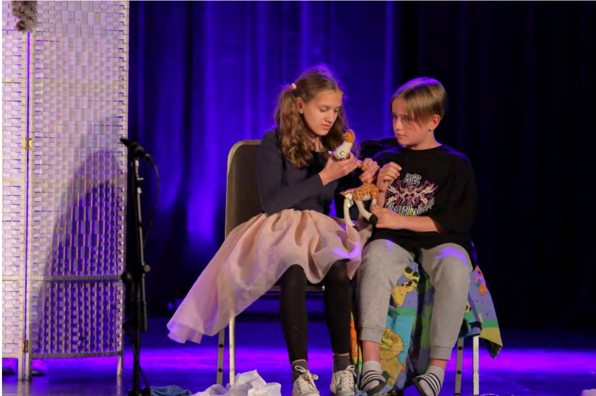
Grupa teatralna Wojewódzkich Konfrontacji Teatrów Dziecięcych „Teatr bez granic”