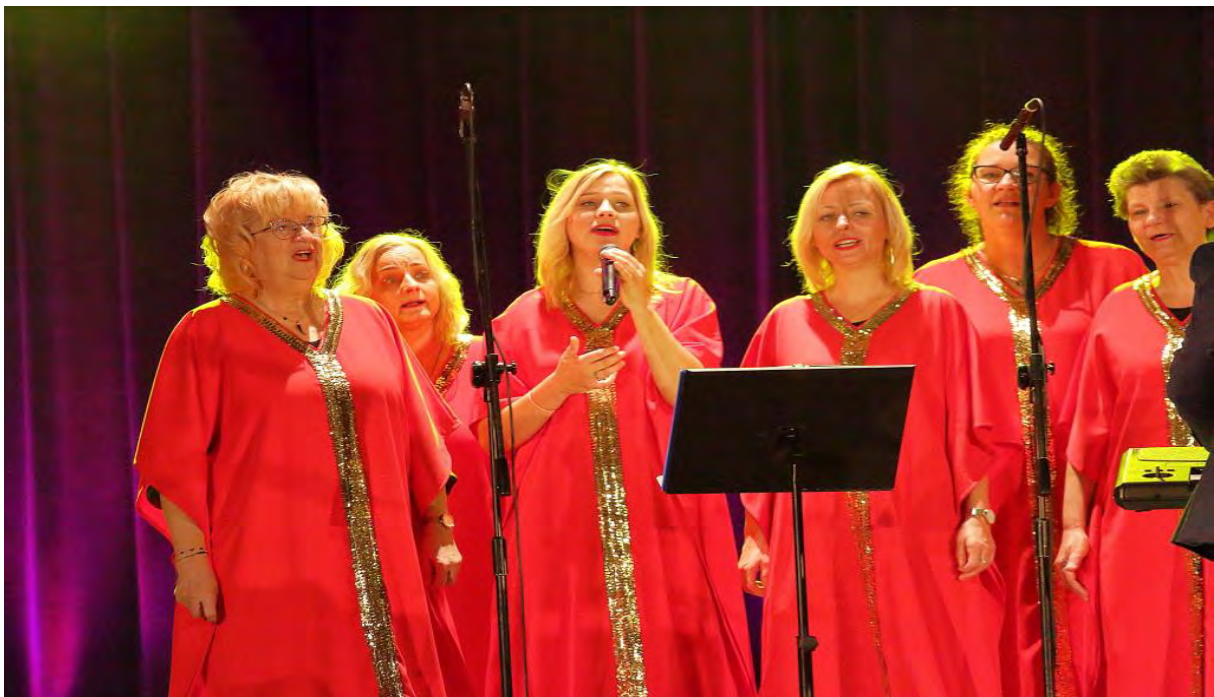
Gospel Ave w Centrum Kultury i Sztuki w Sępólnie Krajeńskim