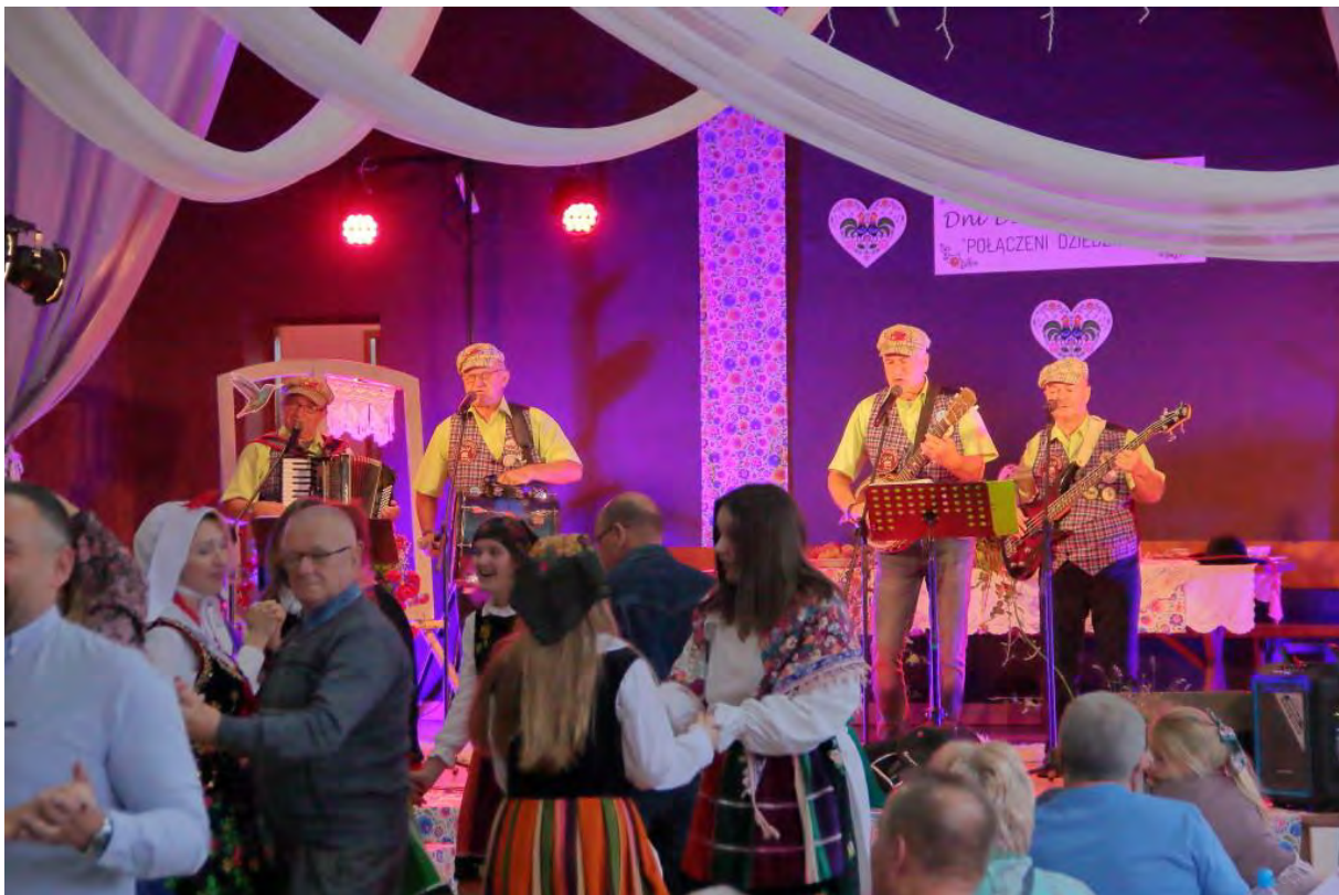
Jarmark św. Mateusza w Wałdowie