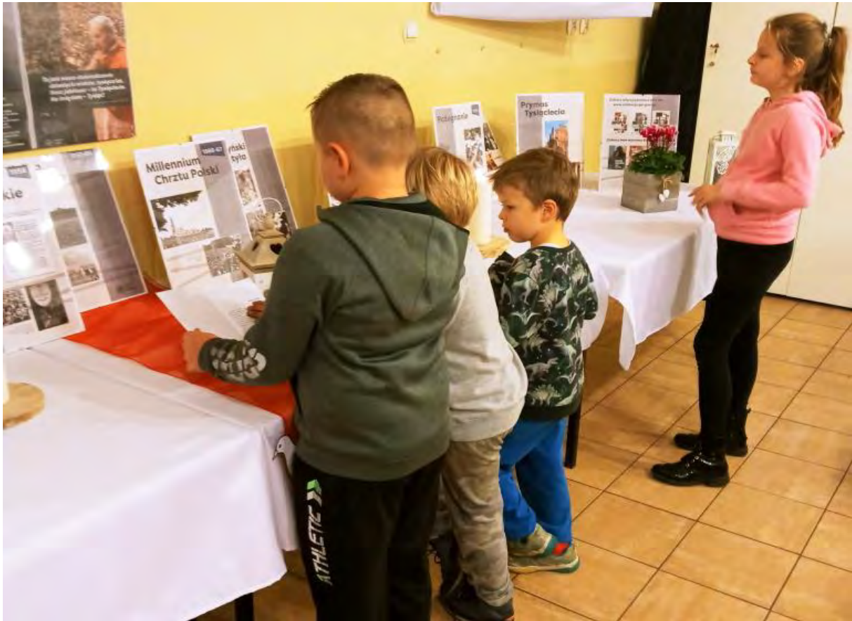
Wystawa o życiu Kardynała Stefana Wyszyńskiego w świetlicy wiejskiej w Wałdówku

12 listopada w świetlicy wiejskiej w Wałdówku odbyło się spotkanie „Ojciec Wolnych Ludzi”, było one poświęcone pamięci Kardynała Stefana Wyszyńskiego. Uczestników wydarzenia zachęcaliśmy do wspólnego śpiewania pieśni patriotycznych. Przy okazji dzieci i młodzież mieli sposobność zagrać w retro gry i zabawy zaczerpnięte z oryginalnych poradników okresu międzywojennego.