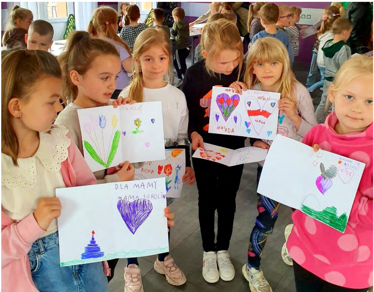
Dzieci z laurkami dla mam!