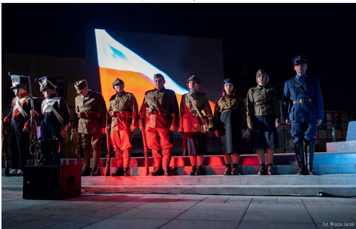
Żołnierze wchodzący w skład grup rekonstrukcyjnych: Grupy Rekonstrukcyjnej „Orzeł Biały” z Gdańska, Stowarzyszenia Historycznego „Garnizon Toruń” oraz Stowarzyszenia „Grupa Rekonstrukcji Historycznych Ziemi Krajeńskiej”