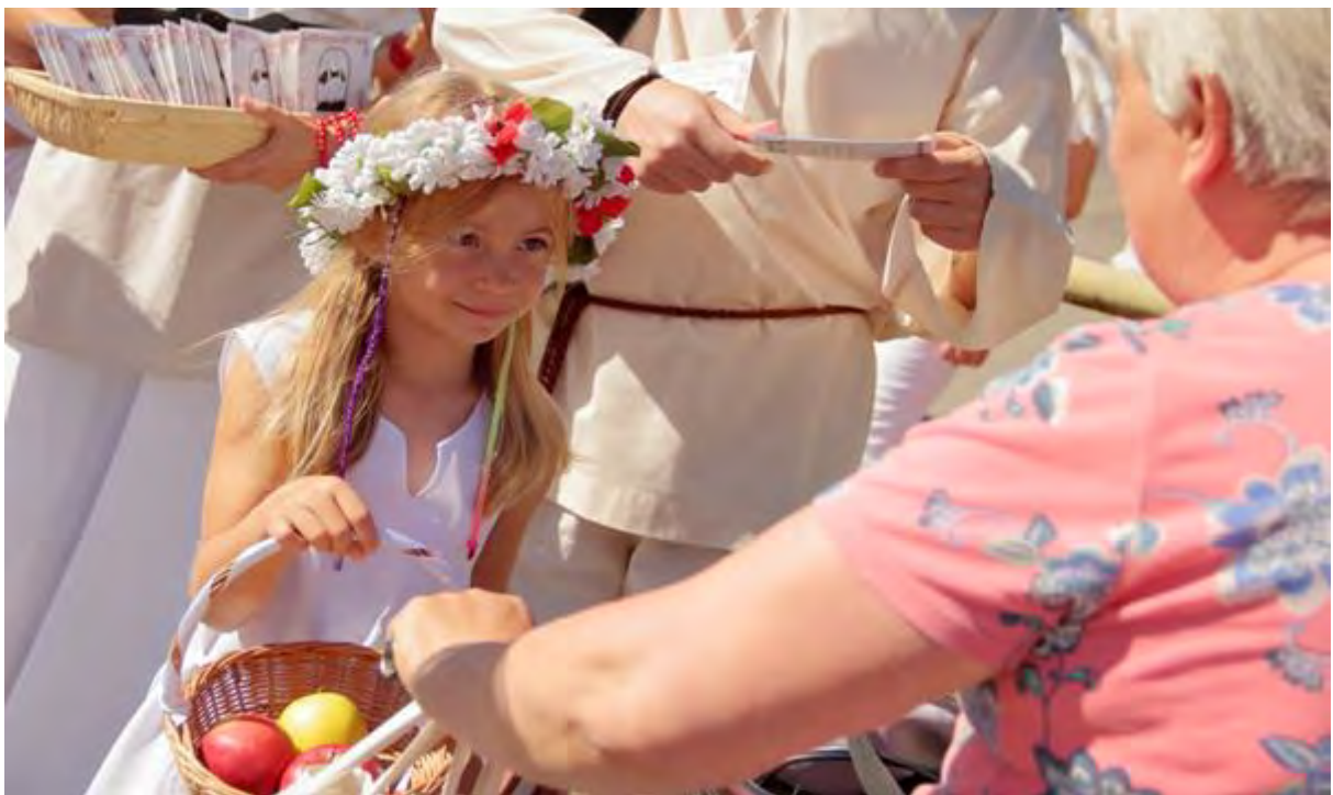
Kultura Smacznego w Sępólnie Krajeńskim