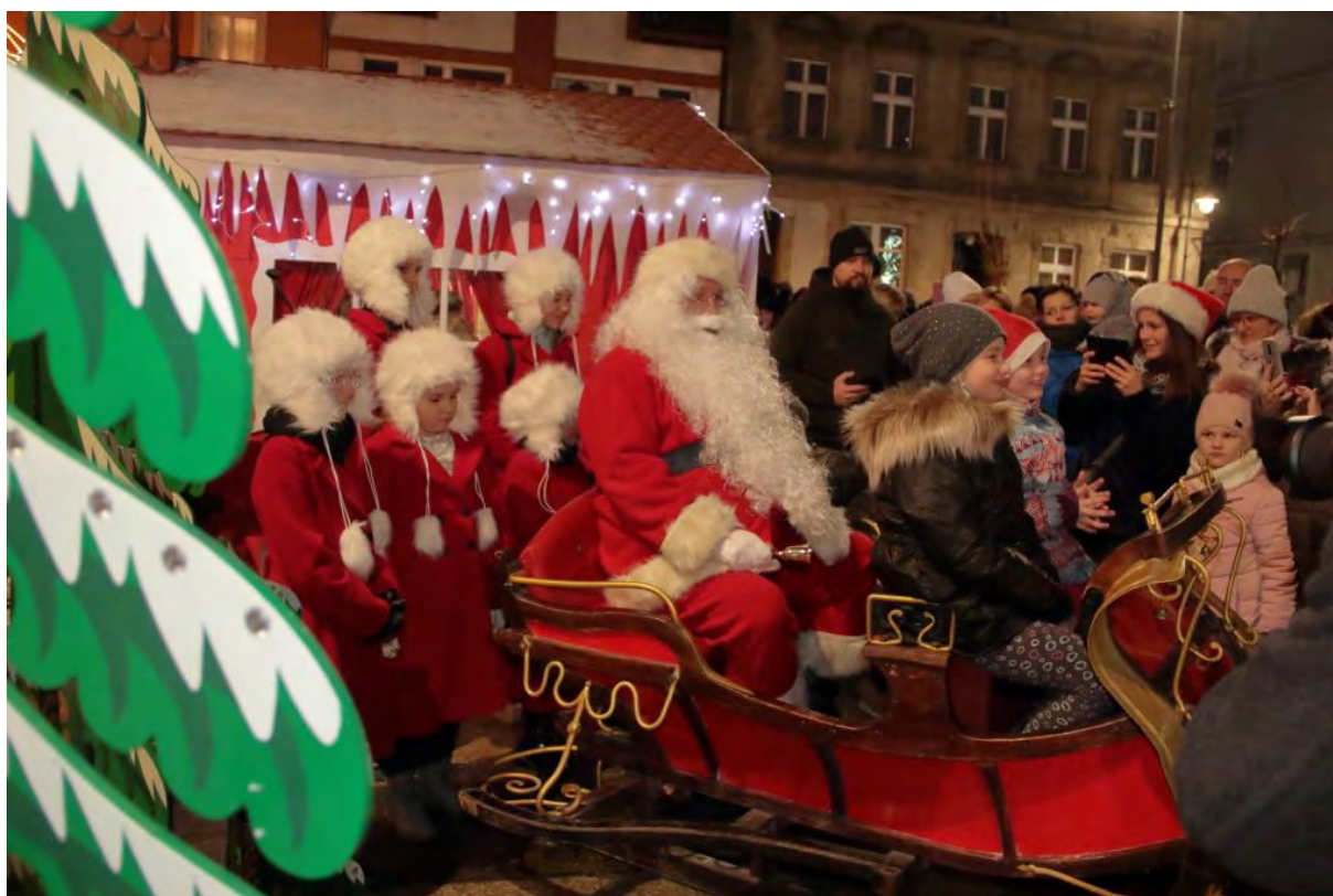
Święty Mikołaj na Placu Wolności w Sępólnie Krajeńskim

Mikołajki to bez wątpienia jeden z najbardziej oczekiwanych dni w świątecznym kalendarzu. Jaka była więc radość, gdy 6 grudnia do centrum naszego miasta przybył prawdziwy Święty Mikołaj! Na naszego gościa oczekiwała już sprowadzona wcześniej prosto z Laponii baśniowa chatka, która wkrótce pękła w szwach w skutek naporu chętnych do zrobienia sobie pamiątkowego zdjęcia z Mikołajem i szepnięcia mu na ucho by spełnił nasze świąteczne prośby. Mikołaj i Pani Mikołajowa musieli przenieść się do zaparkowanych na zewnątrz sań by móc przyjąć i wysłuchać wszystkich zainteresowanych.