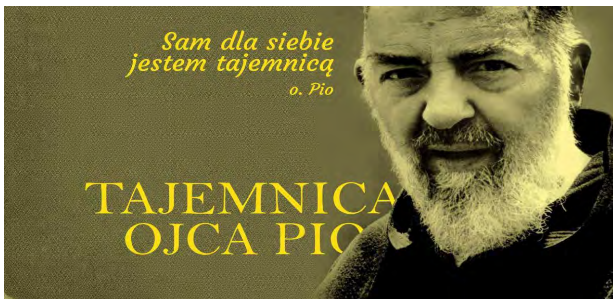
Tajemnica Ojca Pio

Na program ubiegłorocznego Tygodnia Kultury Chrześcijańskiej złożyło się wiele rozmaitych wydarzeń, jednym z nich była projekcja filmu „Tajemnica Ojca Pio”. O św. Ojcu Pio wiele już napisano i powiedziano. W filmie starano się znaleźć odpowiedź na pytanie czy są jeszcze fakty, które powinny ujrzeć światło dzienne? „Tajemnica Ojca Pio” to próba ukazania prawdziwego oblicza Stygmatyka oraz bardzo trudnej drogi, jaką przeszedł, by na jej końcu stać się jednym z największych świętych Kościoła.