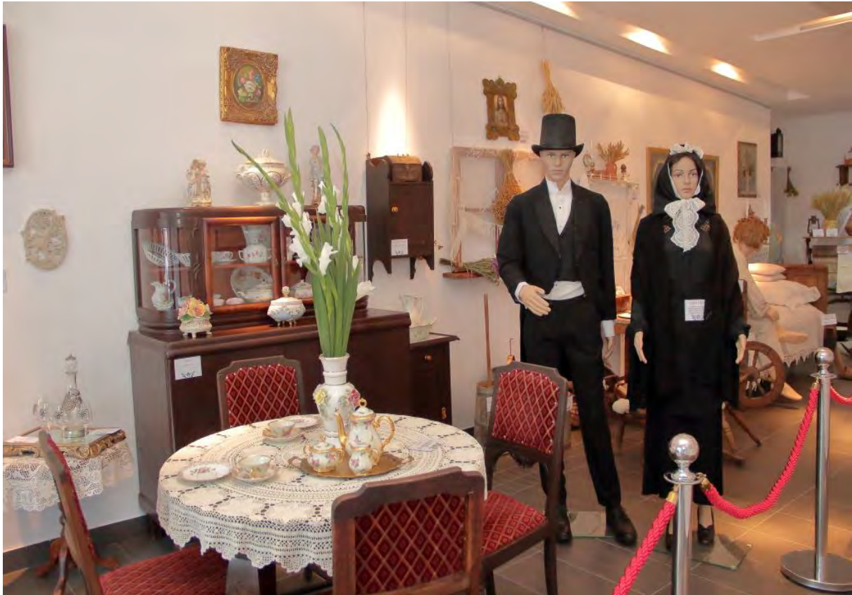
Izba Dziedzictwa Kulturowego w Sępólnie Krajeńskim