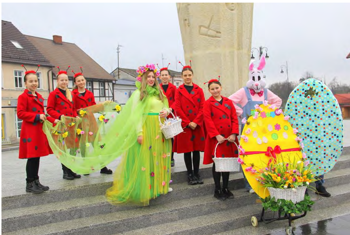
Wielkanocny happening w Sępólnie Krajeńskim