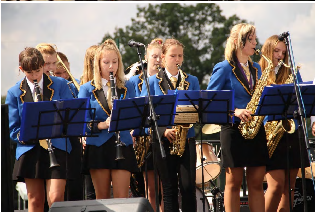
Sępoleńska Orkiestra Dęta