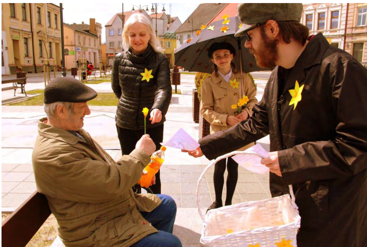
Akcja #Łączy nas pamięć w Sępólnie Krajeńskim

Data 19 kwietnia zapisała się w kartach kalendarza jako dzień, w którym w 1943 roku w getcie warszawskim wybuchło powstanie. Był to największy zbrojny zryw Żydów podczas II wojny światowej. W tym roku obchodziliśmy 79. rocznicę Wybuchu Powstania w Getcie Warszawskim. W ramach akcji „Żonkile” wyszliśmy na ulice Sępólna Krajeńskiego, aby rozdając żonkile uczcić wraz z mieszkańcami naszego miasta Pamięć Ofiar Holocaustu. Jak się okazało pamięć o tragicznych, przeraźliwych wydarzeniach sprzed kilkudziesięciu lat wciąż żyje w nas, czego dowiedli napotkani przez nas mieszkańcy naszego miasta. Pamiętamy oraz żyjemy nadzieją, że w teraźniejszym świecie, rzeczywistości wojennej, która dzieje się „obok” a jednocześnie dotyka serc nas wszystkich, droga pokoju niebawem będzie znów drogą, którą kroczyć będą wszyscy.