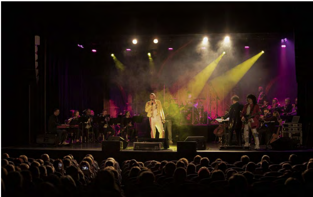
Golden Hits of Queen – Freddie Mercury w CKiS w Sępólnie Krajeńskim

Koncerty Queen zawsze były prawdziwym świętem wspólnotowości. Interakcja jaka zachodziła pomiędzy artystami a widownią powodowała, że stawali się oni jednym organizmem. Właśnie tej jedności potrzebowaliśmy w piątkowy wieczór. W obliczu tragicznych wydarzeń za naszą wschodnią granicą występ ten nabrał zupełnie innego wymiaru. Uniwersalny przesłanie niektórych utworów grupy Queen mówi o tym, że są rzeczy, których nie da się zniszczyć – miłość, przyjaźń, godność i właśnie tę informację muzycy wraz z publicznością, łącząc się w chór, przestali światu ze sceny w Sępólnie Krajeńskim.