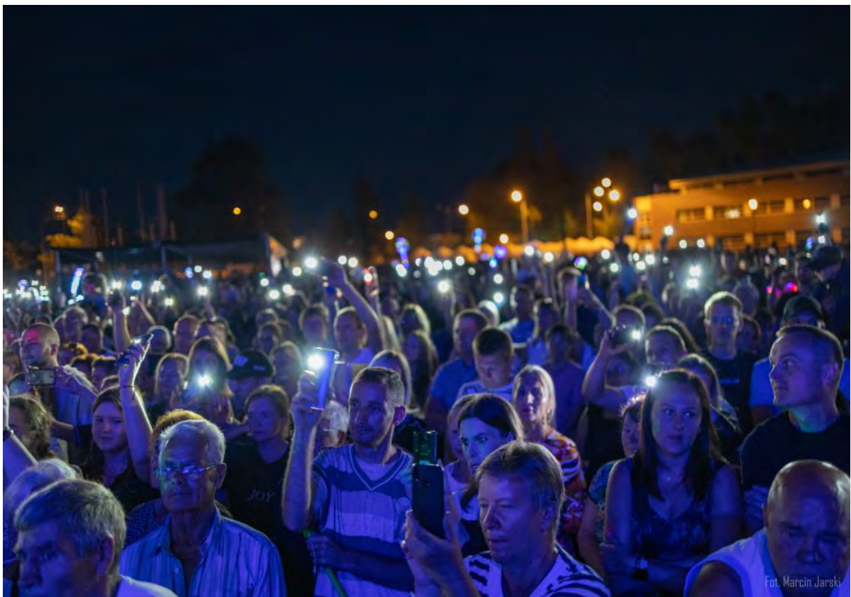
Koncert zespołu Varius Manx & Kasia Stankiewicz