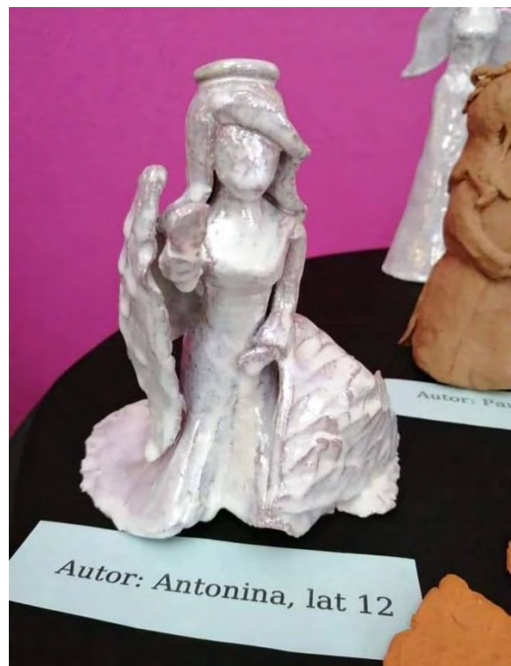
Wystawa „Anielskie natchnienia”