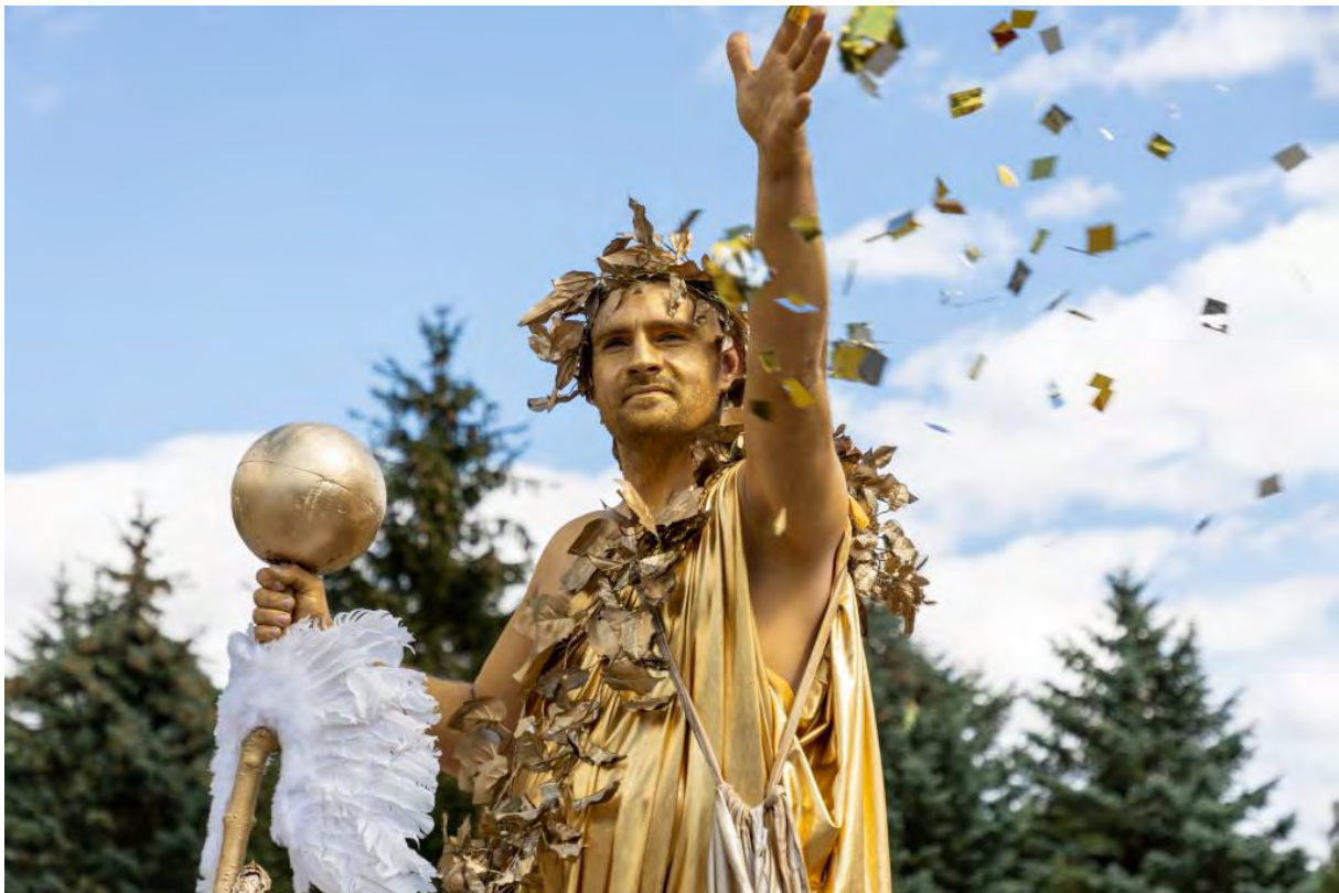
Otwarcie Jarmarku św. Wawrzyńca w Sępólnie Krajeńskim