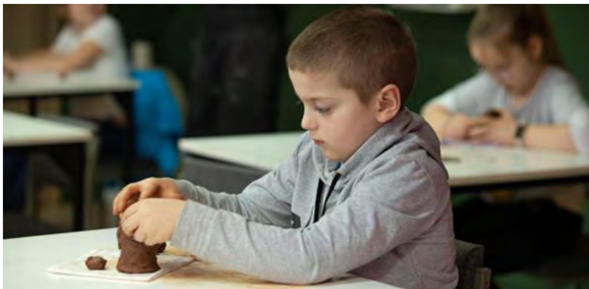
Zajęcia ceramiczne dla dzieci