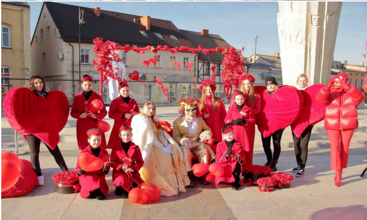
Zakochani w Sępólnie! Event na Placu Wolności w Sępólnie Krajeńskim