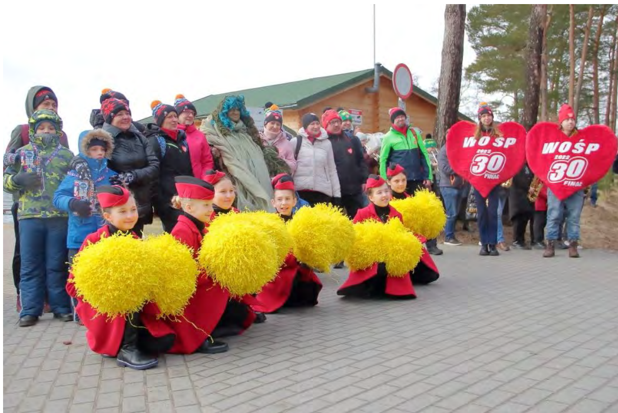
30. Finał WOŚP w Sępólnie Krajeńskim