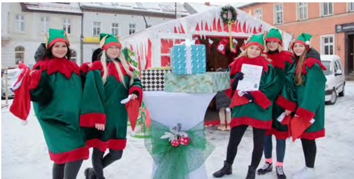
Elfy Świętego Mikołaja w Sępólnie Krajeńskim