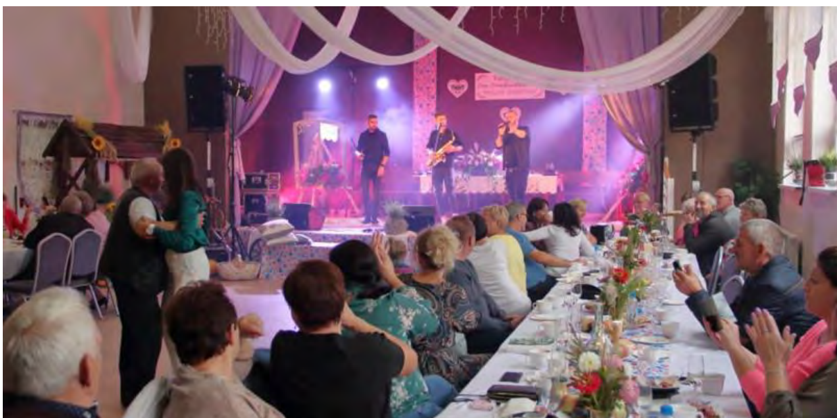
Jarmark św. Mateusza w Wałdowie