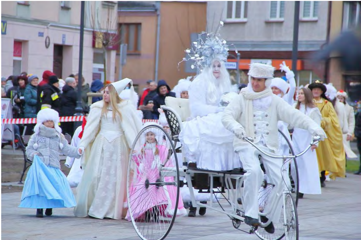
Królowa Śniegu - Dzień Adwentowy w Sępólnie Krajeńskim

Nie ukrywamy, że staraliśmy się nieco „zaczarować” rzeczywistość, odwołując się do baśni i bajek, pięknych, uniwersalnych opowieści o tym, że dobro zwycięża zło, że miłość, przyjaźń, wspólnotowość to największe skarby, pragnęliśmy wlać w Państwa serca odrobinę optymizmu w tych niełatwych czasach. Okres zbliżających się świąt Bożego Narodzenia, to jednak okres magiczny i wyjątkowy. Okres, w którym niejednokrotnie spełniają się marzenia, choćby te najmniejsze, które czasami mają moc rozświetlania szarej rzeczywistości. Zadaniem gości Królowej Śniegu było umocnić w Państwie przekonanie, że te święta mogą być bajeczne.