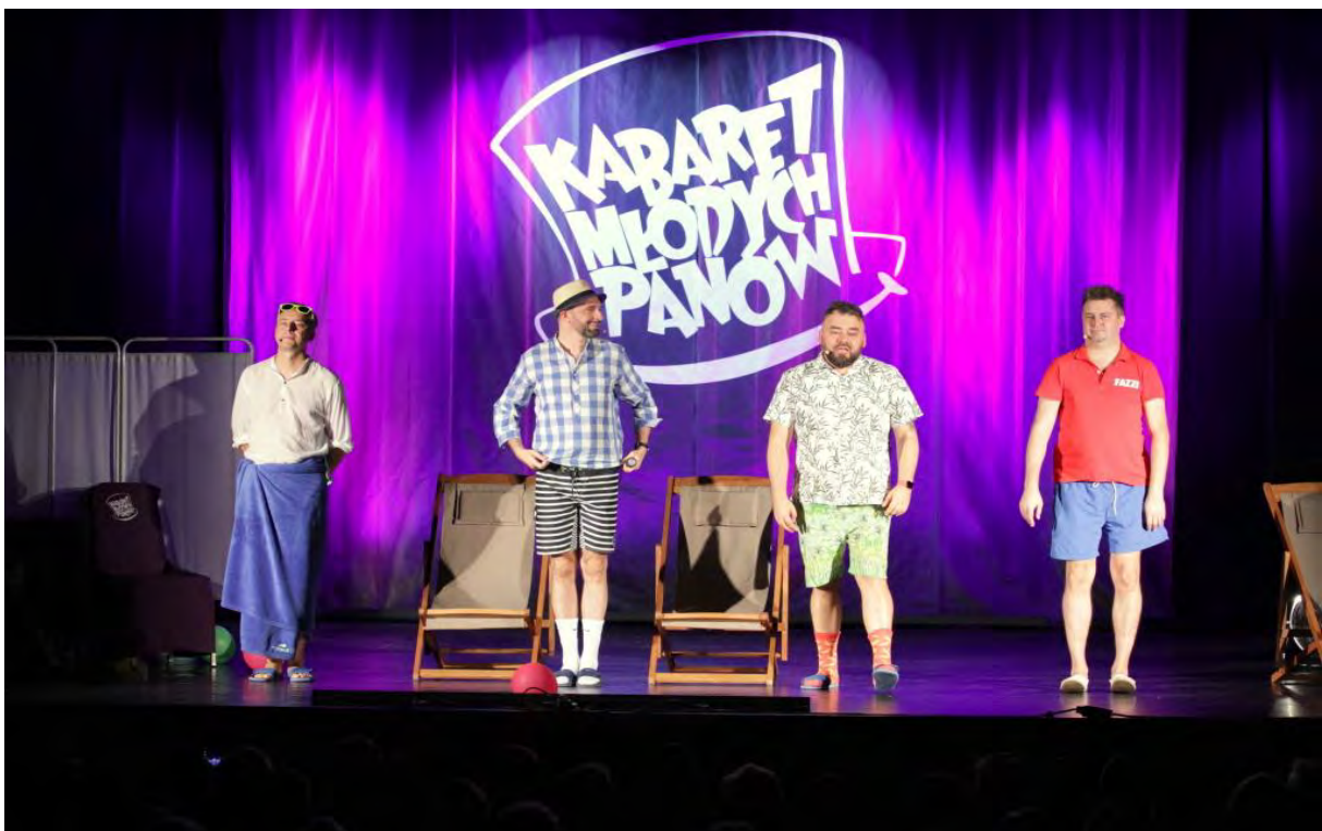
Kabaret Młodych Panów w Centrum Kultury i Sztuki w Sępólnie Krajeńskim