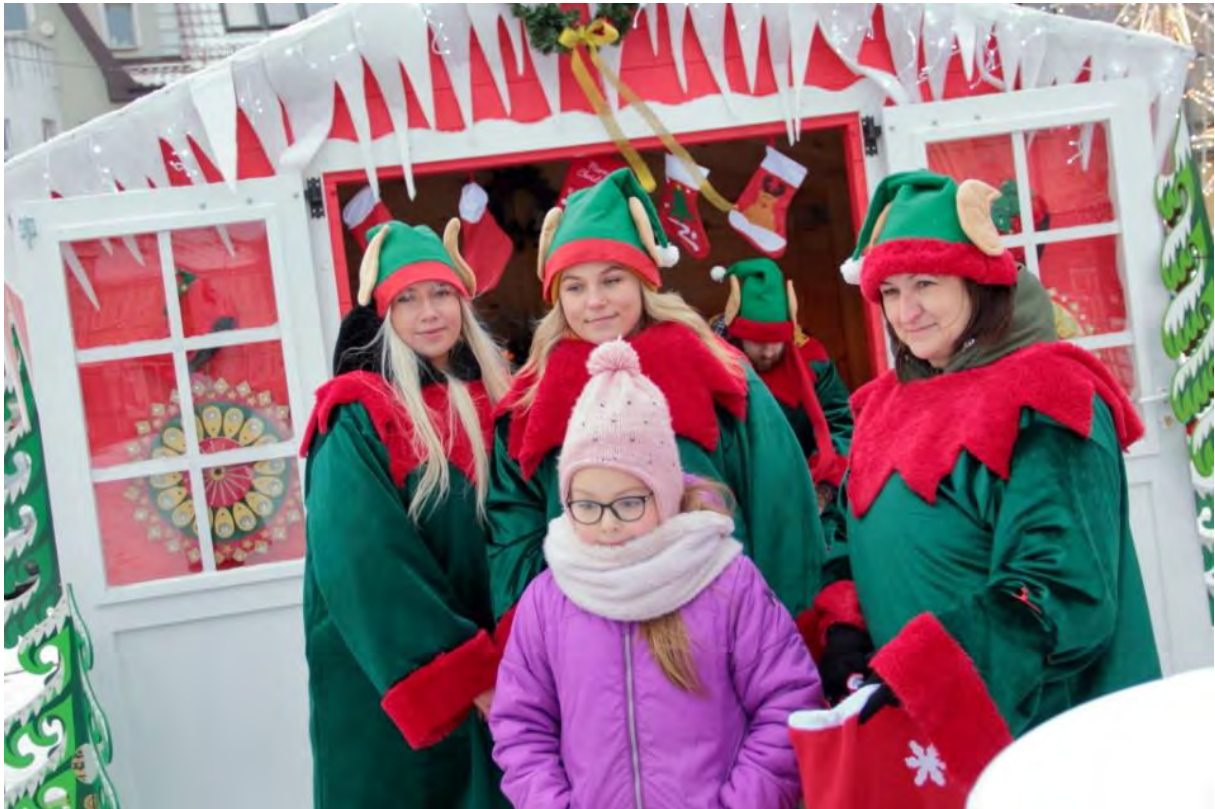
Mobilny dom Świętego Mikołaja na Placu Wolności w Sępólnie Krajeńskim

Nie jest tajemnicą, że Święty Mikołaj co roku wyruszając w świąteczną trasę zatrzymuje się w Sępólnie Krajeńskim. Bywało tak, że zmęczony podróżą zasypiał w centrum miasta i przy pomocy przedszkolaków, musieliśmy budzić go by zdążył odwiedzić wszystkie oczekujące na niego dzieci. Tym razem Święty postanowił zostać u nas nieco dłużej. Z początkiem grudnia na rynku miejskim pojawił się sprowadzony prosto z Laponii mobilny dom Świętego Mikołaja! Zapracowany Święty zabrał ze sobą w podróż elfy, które przyjmowały w jego imieniu listy. Takiej okazji nie można było przegapić, toteż do mikołajowej chatki ustawiały się prawdziwe tłumy!