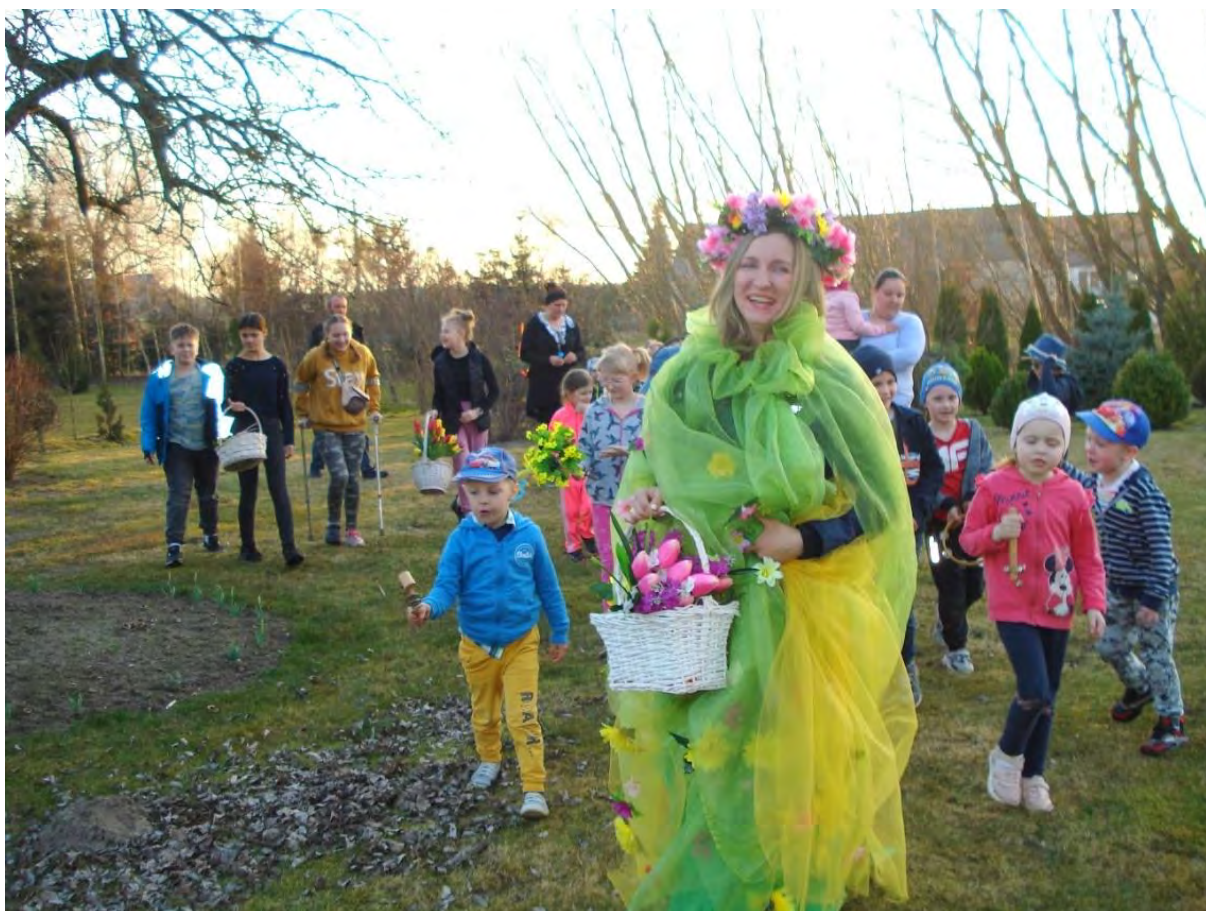
Przywitanie WIOSNY w Wiejskim Ośrodku Kultury w Lutowie

Kalendarzowa Wiosna nadeszła, jej oznaki zaobserwowaliśmy najpierw w przydomowych ogródkach i na łące. W lutowskim WOKu zagościła także na oknach. Nie obyło się bez tradycyjnego puszczania w podróż do morza „Marzanny”. Po tym rytuale tanecznym krokiem uroczyste powitaliśmy Panią Wiosnę.