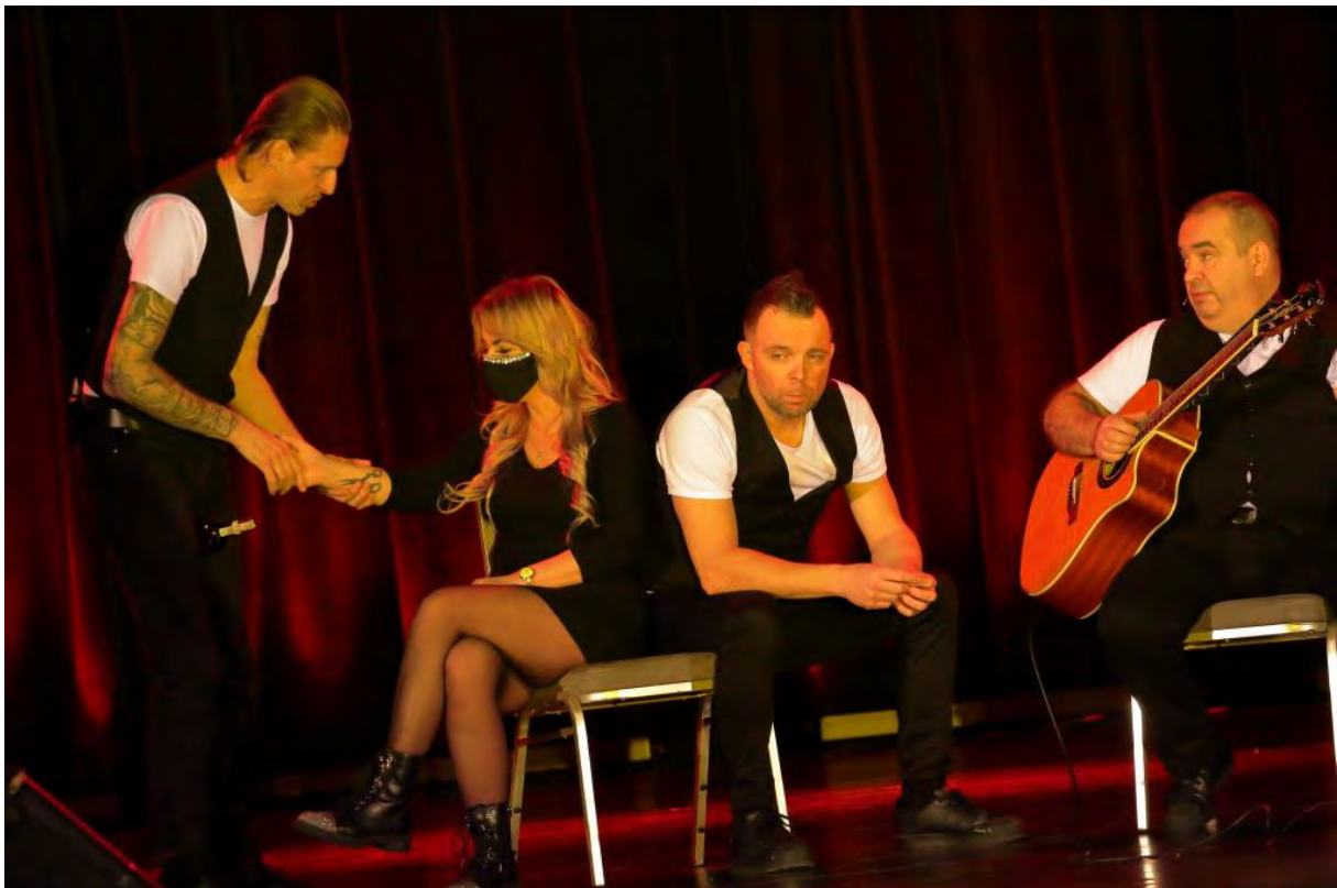
Kabaret Ani Mru Mru w Centrum Kultury i Sztuki w Sępólnie Krajeńskim

Sępoleńska Scena Kabaretowa gościła już niemal wszystkie najpopularniejsze rodzime składy kabaretowe – wśród nich Ani Mru Mru zajmuje szczególne miejsce. Od 23 lat bawią do łez i trafiają do odbiorców w różnym wieku. Pozostając w sferze porównań kulinarnych można by rzec, że spotkania z Ani Mru Mru są prawdziwą ucztą, nic więc dziwnego, że ich „rolada humoru” smakuje wyśmienicie.