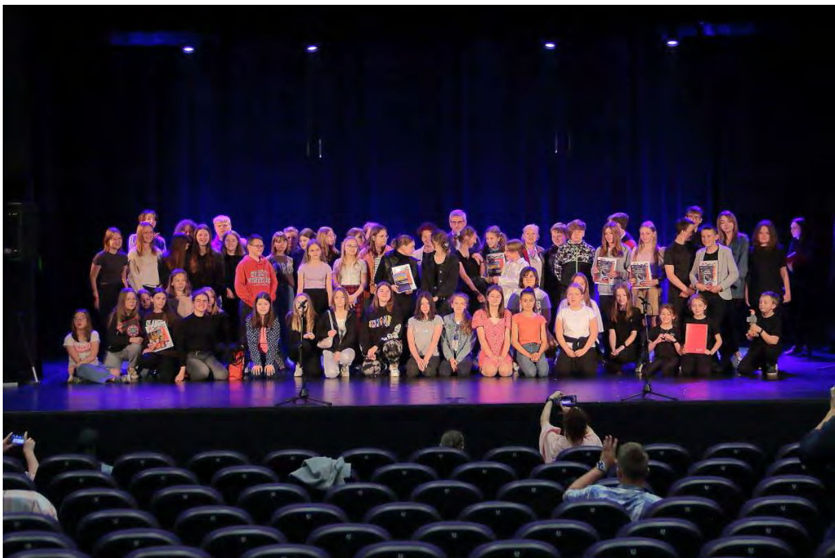
Laureaci Wojewódzkich Konfrontacji Teatrów Dziecięcych „Teatr bez granic”