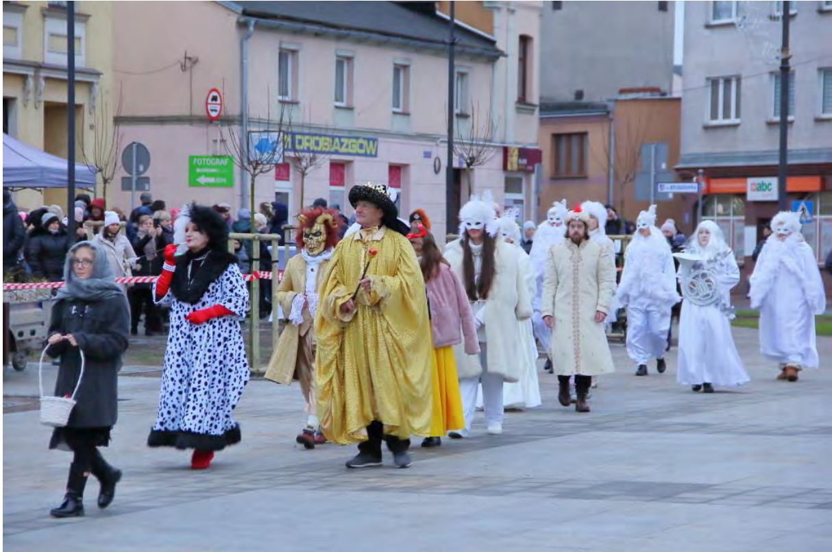
Orszak podczas Dnia Adwentowego w Sępólnie Krajeńskim