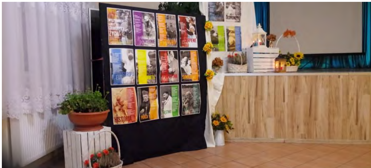
Wystawa „Wyszyńskiego i Wojtyły gramatyka życia” w Wiejskim Ośrodku Kultury w Lutowie