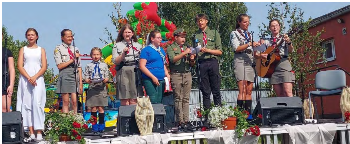
Noc Świętojańska w Wiejskim Ośrodku Kultury w Wałdowie