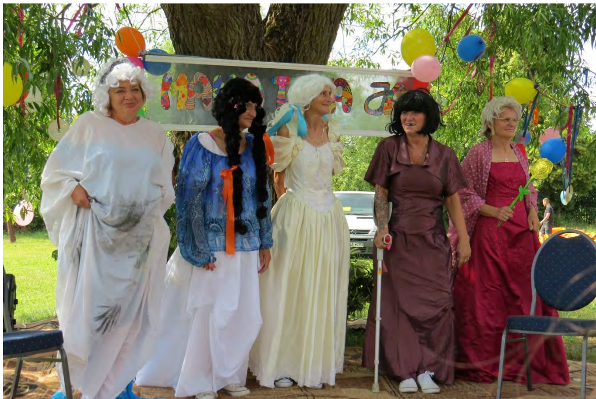
Piknik Rodzinny z Kopciuszkiem w Iłowie