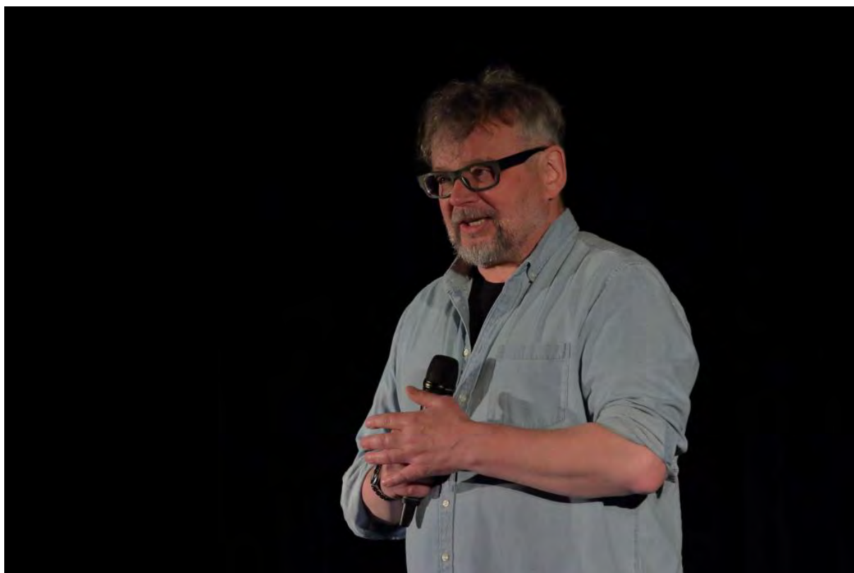
Piotr Bałtroczyk w CKiS w Sępólnie Krajeńskim

Bałtroczyk bawi, bo jego żart jest bliski życia przeciętnego Kowalskiego, a jednocześnie ma on w sobie intelektualny błysk i pozwala docenić szlifowany przez lata kunszt, który doprowadzony do perfekcji zyskał mu miano jednego z najlepszych w swoim niełatwym zawodzie. Dwie godziny wielotematycznego monologu upłynęły niesprawiedliwie szybko, próżno było oczekiwać od naszego gościa bisu – jako zagorzały fan piłki nożnej spieszył się na finałowy mecz Ligi Mistrzów. Nie dowiedzieliśmy się niestety z którym zespołem sympatyzuje, toteż nie wiemy czy wizytę w Sępólnie Krajeńskim będzie wspominał jako wieczór triumfu czy klęski swojej ulubionej drużyny. My niewątpliwie zapamiętamy ją jako jeden z najweselszych wieczorów w historii Centrum Kultury i Sztuki.