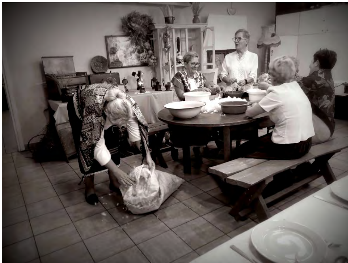
Europejskie Dni Dziedzictwa w Wałdówku

Trwają Europejskie Dni Dziedzictwa 2022 na terenie gminy Sępólno Krajeńskie. W tym roku obchodzimy 30. jubileuszową edycję pod hasłem „Połączeni Dziedzictwem”. Tegoroczne hasło EDD łączy pokolenia, przeszłość z przyszłością, wzmacnia poczucie tożsamości i wspólnoty i zachęca, by społeczeństwo integrowało się wokół lokalnych zabytków oraz dziedzictwa niematerialnego. Mieszkańcy Gminy Sępólno Krajeńskie bardzo chętnie biorą udział w tego typu wydarzeniach, ponieważ w ramach EDD organizowane są tematyczne spotkania wielopokoleniowe, które integrują społeczność wiejską. Przedstawiamy Państwu krótką fotorelację z dotychczasowych wydarzeń, które miały miejsce w świetlicach wiejskich na terenie gminy Sępólno Krajeńskie. Nie zabrakło tradycji pisania listów, przygotowania posagu dla Panny Młodej, nauki dawnych i współczesnych zasad savoir vivre, tradycji darcia pierza i swaty, wspólnych chwil na dawnej wsi i muzyki, która nie tylko dostarczała kiedyś energii, ale przede wszystkim łączyła pokolenia.