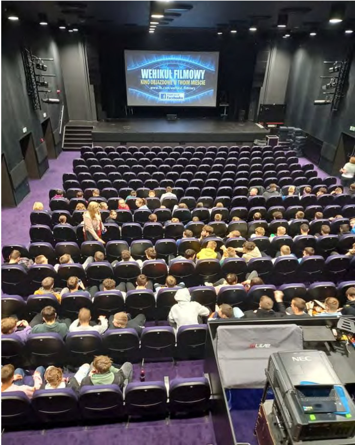
Sala widowiskowo-kinowa w Centrum Kultury i Sztuki w Sępólnie Krajeńskim