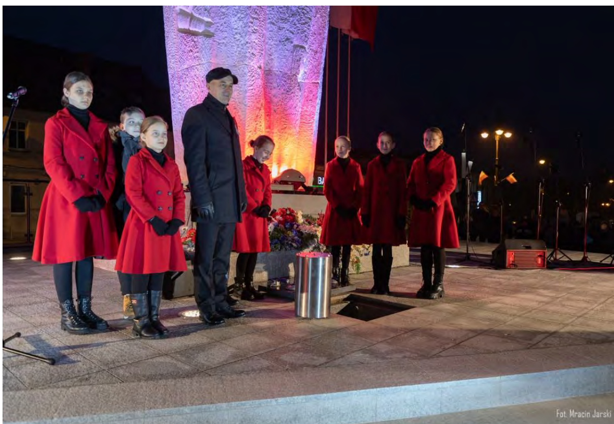
Pomnik Walki i Męczeństwa w Sępólnie Krajeńskim