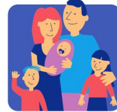
KARTA DUŻEJ RODZINY

Od stycznia 2022 roku do grudnia 2022 roku wpłynęło 158 wniosków o Kartę Dużej Rodziny. Każdy posiadacz Karty Dużej Rodziny – niezależnie od tego czy do tej pory miał ją w wersji tradycyjnej, elektronicznej czy obu – od dnia 9 czerwca 2021 roku może z niej korzystać dzięki praktycznej aplikacji mObywatel.